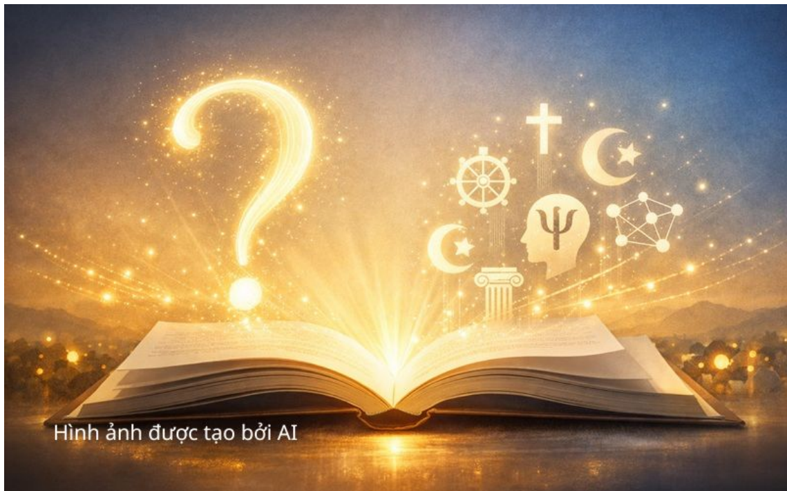
Hình ảnh được tạo bởi AI

Tính chặt chẽ trong phương pháp của Kent trở nên đặc biệt quan trọng khi xem xét những trường hợp đương đại lẽ ra phải khơi dậy sự hoài nghi ngay lập tức.