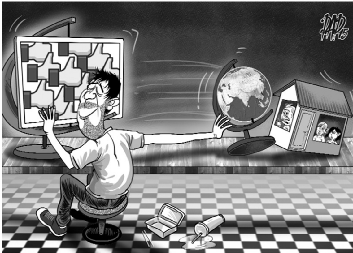
Hình minh họa "bệnh sống ảo".

“Trí tuệ Bát-nhã bao hàm tất cả tri thức học vấn thế gian và xuất thế gian” [xi]. Điều đó cho thấy công nghệ tự thân không xấu; vấn đề nằm ở cách con người tiếp cận và vận dụng. Tỉnh thức trước thế giới số là biết dùng công nghệ để học tập, phát triển bản thân, thay vì để bản thân bị công nghệ điều khiển.