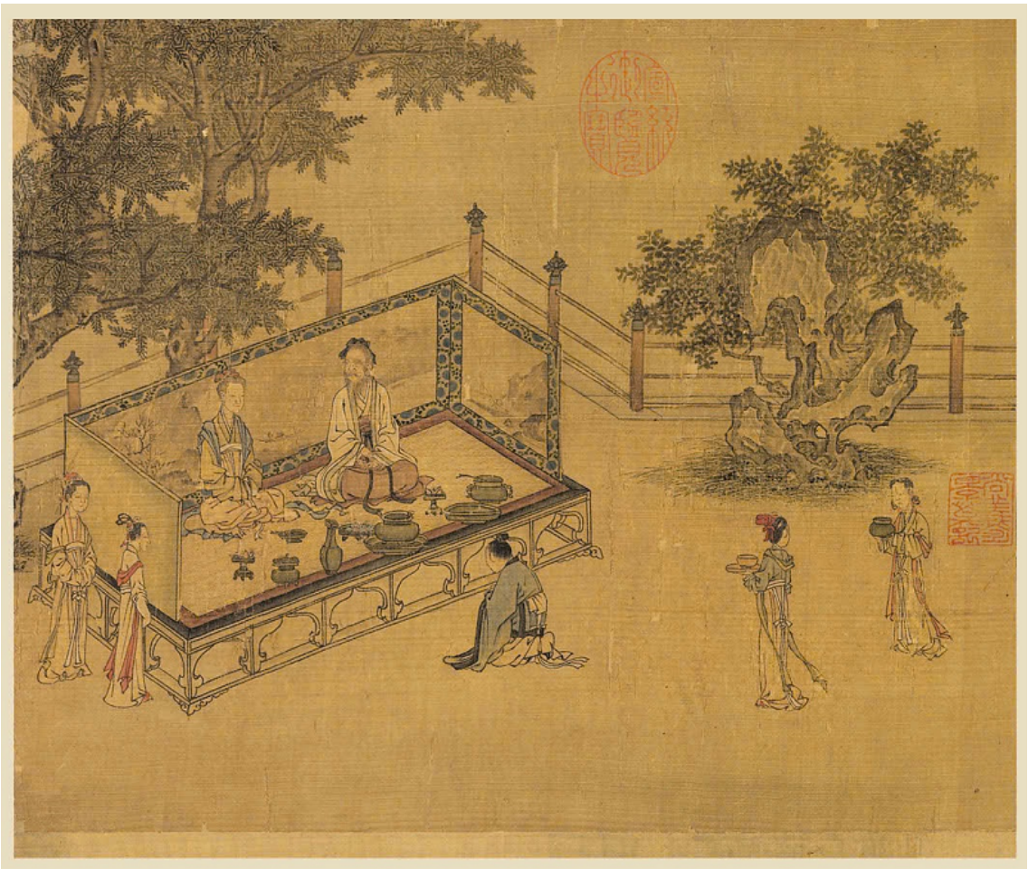
Hình vẽ trong Hiếu kinh, bản vẽ thời nhà Tống

Hiếu kinh viết: “... Thân thể tóc da, nhận từ cha mẹ, không dám tổn thương đó là khởi đầu của hiếu. Lập thân hành đạo, dương danh với hậu thế, để làm rạng rỡ cha mẹ, đó là kết cục của hiếu. Xét về hiếu, khởi đầu là lo việc song thân, kế đến là việc vua tôi, sau cùng mới đến việc lập thân. ”