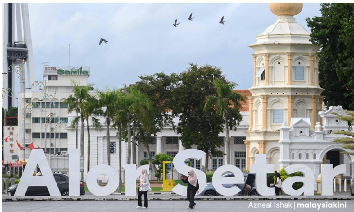
Alor Setar, Kedah

Báo cáo thường niên năm 1957 của Liên bang Malaya cũng đề cập những bằng chứng cho thấy các cộng đồng người Nam Ấn từng cư trú đáng kể quanh khu vực núi Kedah từ thế kỷ IV đến thế kỷ XII.