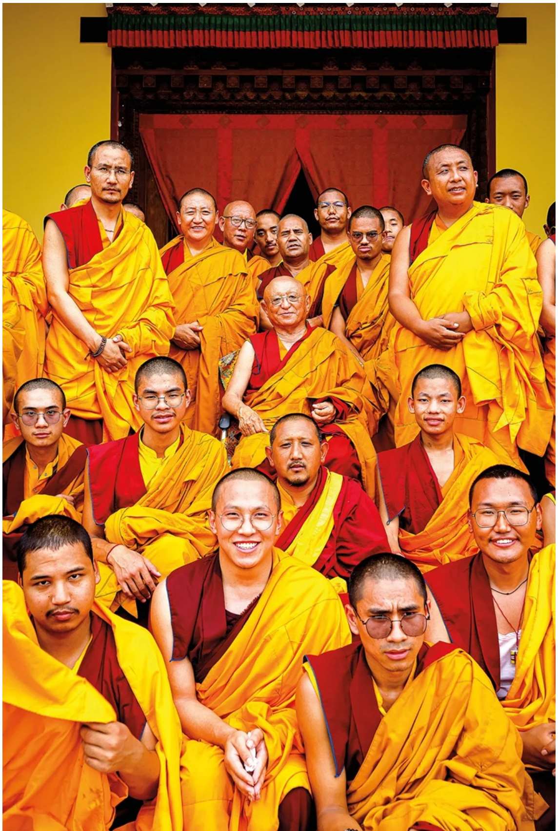
Các tăng sĩ Tây Tạng vây quanh vị trụ trì của mình (ngồi giữa).