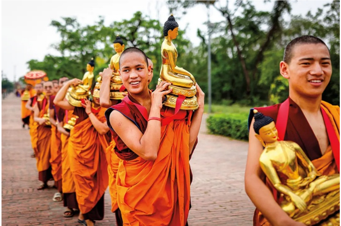
Các tăng sĩ Phật giáo Tây Tạng rước tượng Phật qua các tuyến phố.

+ Trung tâm Văn hóa và Làng Lumbini Mới (Cultural Center and New Lumbini Village): nơi có bảo tàng, viện nghiên cứu Phật học quốc tế, Đại Bảo tháp Hòa bình Thế giới và khu bảo tồn chim sếu.