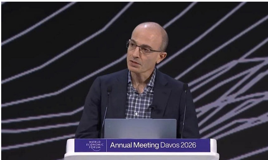
Thiền giả Yuval Noah Harari

Đại cuộc biến dịch ấy có thể ập đến ngay trong hai năm tới hoặc hiển lộ vào thập kỷ kế tiếp. Sử gia kiêm hành giả Yuval Noah Harari đã phát đi lời cảnh báo đanh thép: Trí tuệ nhân tạo (AI) ngày nay đã bám rễ sâu vào rường cột xã hội. Đến mức, tất cả những gì được cấu thành từ ngôn từ, điển hình là các tôn giáo cổ đại như Kitô giáo và Do Thái giáo, đứng trước nguy cơ bị thực thể này thôn tóm, tiếp quản hoàn toàn.