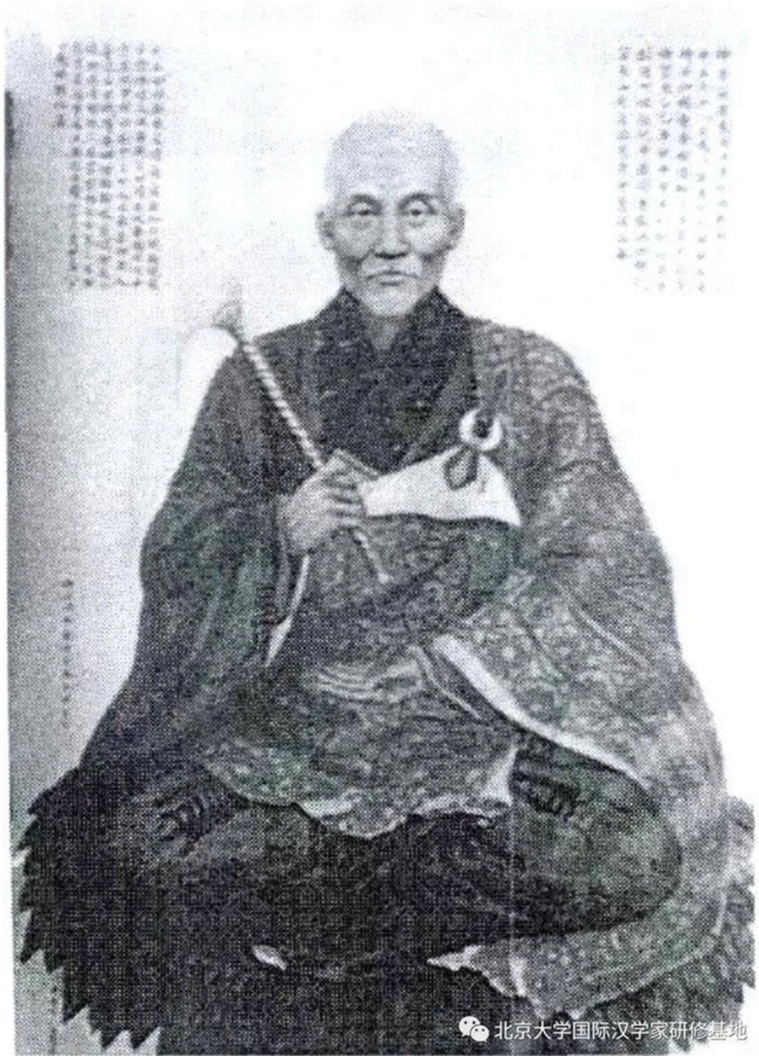
Di ảnh Tổ sư Nguyên Thiều

Thiền sư Nguyên Thiều (1648-1728), pháp tự Hoán Bích, họ Tạ, nguyên quán tại huyện Trình Hương, phủ Triều Châu, tỉnh Quảng Đông, Trung Hoa. Năm 1666 (mười chín tuổi), ngài xuất gia tại chùa Báo Tư. Đến năm 1677, ngài theo thuyền buôn sang phương Nam để truyền đạo, dừng chân tại phủ Quy Ninh (nay thuộc tỉnh Bình Định), nơi ngài khai sơn Tổ đình Thập Tháp Di Đà.