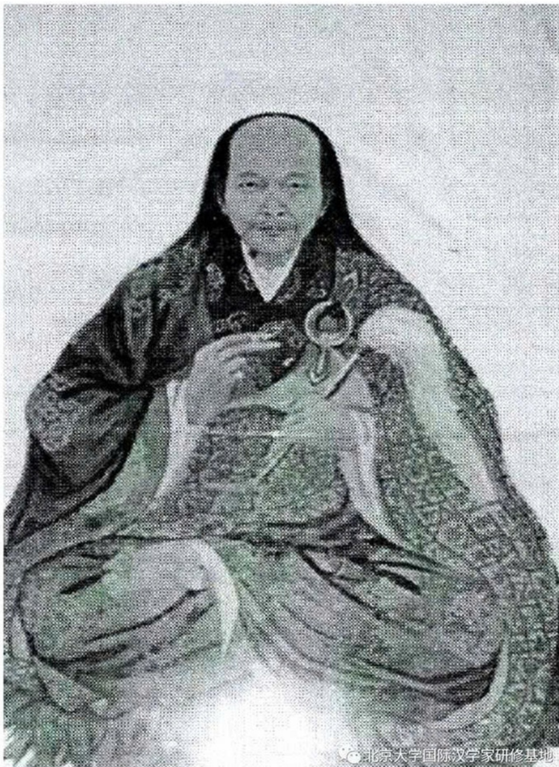
Di ảnh Thiền sư Đại Xán Thạch Liêm

Sau đó, ngài trở lại vùng núi Phú Xuân thuộc Thuận Hóa để kiến tạo chùa Quốc Ân. Đồng thời, tuân theo chỉ dụ, ngài sang chùa Trường Thọ ở Quảng Châu (Trung Quốc) để cung thỉnh Thiền sư Đại Xán Thạch Liêm (1633-1704) - vị cao tăng nổi pháp mạch Thiền phái Tào Động đời thứ 29 - cùng nhiều tượng Phật và pháp khí sang nước ta. Trong lần trở lại Quảng Đông để tiếp tục thỉnh pháp tượng, pháp khí và cung thỉnh các bậc tăng sĩ, ngài đã mang về nhiều bộ Phật điển quý giá.