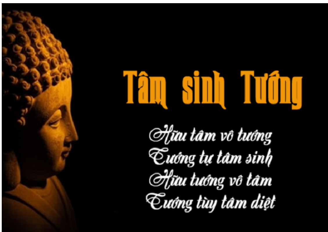
Ảnh minh họa (sưu tầm)

Người bình thường thiếu tập trung cho một công việc sẽ khó thành công, không đạt kết quả; một hành giả nhiều tưởng thức dễ đưa đến tẩu hỏa, hoang tưởng, bị lạc dẫn vào cảnh giới siêu thực. Tưởng thức là loại ma tâm, tần số tâm thức bị loạn nhịp hợp với tần số âm ngoại biên dẫn đến bất bình thường. Người không bình thường do hoang tưởng hiển lộ ra gương mặt, cặp mắt, hành động. Một người thiếu thiện cảm với ta, tuy không thể hiện ra hành động hay lời nói, ta vẫn cảm nhận được. Như vậy tưởng là loại năng lượng bao phủ quanh ta; tạp tưởng thì khó phát hiện, tưởng thức mạnh sẽ hiển lộ rõ nét.