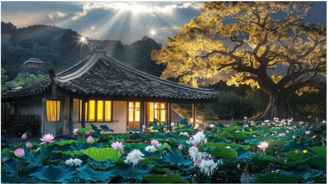
Hình minh họa được tạo bởi công nghệ AI.

Khó có thể định nghĩa tâm linh là gì, song có thể khẳng định chỉ có con người mới có được khái niệm về tâm linh, trừ những người mang các bệnh lý tổn thương thực thể hay chức phận tại vỏ não, ví dụ: các bệnh về cấu trúc não bộ hoặc rối loạn chức năng như não úng thủy, bệnh Down, bệnh Alzheimer người già, bệnh tâm thần phân liệt... những người mắc các bệnh này sẽ không có đầy đủ ý niệm về tâm linh, có chăng chỉ là ảo giác không hiện thực.