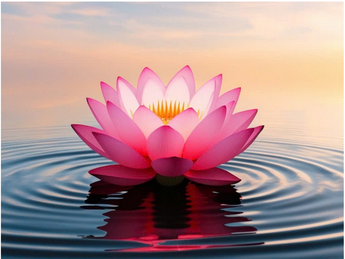
Hình minh họa được tạo bởi công nghệ AI.

Nhân nói về đề tài tâm linh, tôi xin được kể ra đây những câu chuyện có thật mà bản thân tôi đã trải qua, tôi cũng không khẳng định rằng những trường hợp này là có liên quan đến yếu tố tâm linh hay chỉ là sự trùng hợp ngẫu nhiên nhưng với một người có đức tin vào nhân quả, vào sự mầu nhiệm của Phật pháp thì tôi tin rằng con người vẫn đang sống trong một bể mặt dòng chảy với những điều bí ẩn chưa thể lý giải.