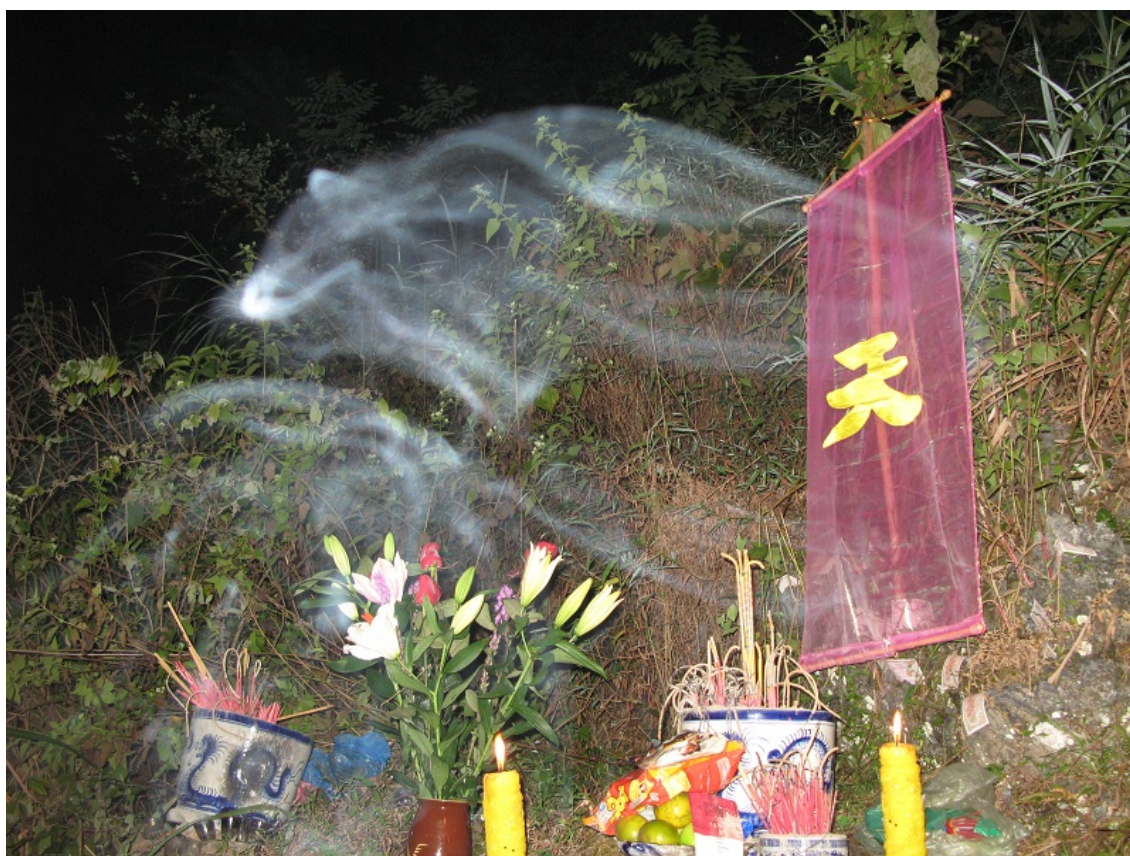
Hình mang tính minh họa

Chữ “Linh” (𤄎) gồm hai bộ là bộ (𤄎) ở bên trên, và bộ “Hỏa” (火) ở bên dưới. Hỏa có nghĩa là lửa, nhiệt, nóng,...ở đây nó tượng trưng cho sự sống.