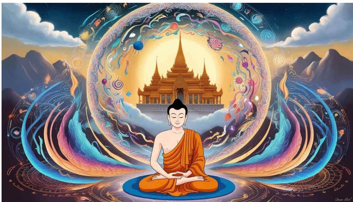
Hình minh họa được tạo bởi công nghệ AI.

Đạo Phật trước hết là những phương tiện chỉ dẫn thực nghiệm tâm linh để khám phá thực tại. Kinh sách có giá trị như những đồ biểu hướng dẫn và phương pháp thiền quán có giá trị như một con tàu để đưa người hành giả tới bến bờ hiểu biết và để thực hiện sự hiểu biết ấy trong sự sống bản thân và sự sống xã hội. Chữ “buddh” có nghĩa là hiểu biết do đó có chữ “buddha”, người hiểu biết, và sau này chữ “buddhism”, con đường của sự hiểu biết. Hiểu biết ở đây không phải là cái hiểu biết sách vở và kinh điển mà là bản thân của chính thực tại hiện rõ dưới khả năng trí tuệ bát nhã (prajna) chỉ có thể đạt đến do công phu tu tập thiền quán.