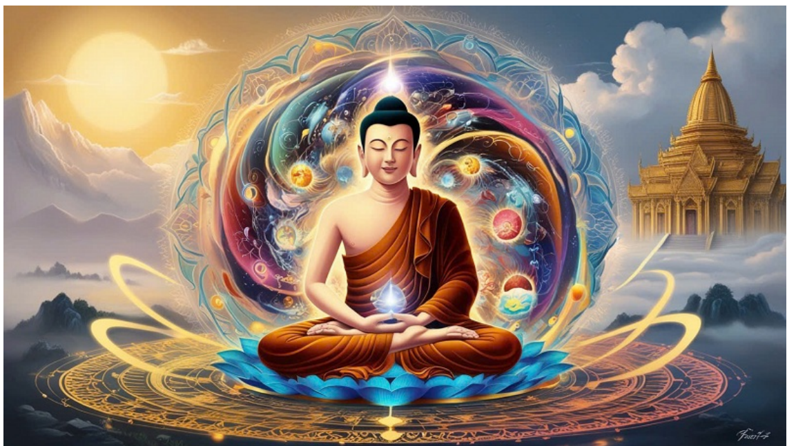
Hình minh họa được tạo bởi công nghệ AI.