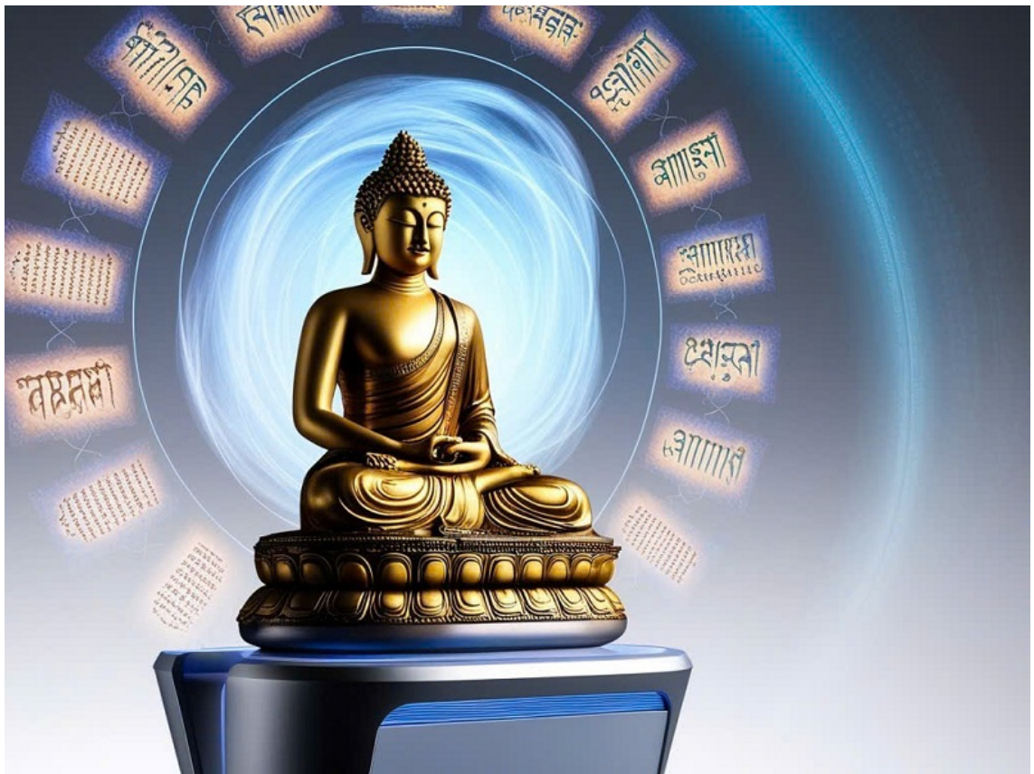
Hình minh họa được tạo bởi công nghệ AI.

Khi có đời sống tâm linh sẽ giúp con người biết hướng thiện, tin vào nhân quả, biết làm lành tránh dữ, gìn giữ những giá trị đạo đức, văn hóa xã hội và phát triển nền tảng ý thức con người, giữ gìn bản sắc, truyền thống dân tộc. Đó là lý do hình thành nên quan niệm “Có thờ có thiêng, có kiêng có lành” để nhắc nhở mỗi người chúng ta, khi điều gì chưa biết, chưa thể khẳng định đúng sai thì nên tôn trọng, giữ gìn ý tứ, không nên giễu cợt hoặc mạo phạm. Bên cạnh đó, cũng là cách dung hòa giữa việc thờ cúng Tổ tiên, ông bà với tín ngưỡng Tôn giáo.