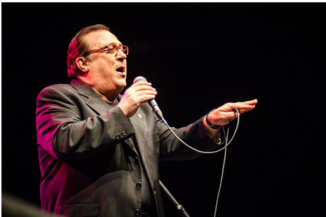
Robertino Loreti tại một buổi hòa nhạc năm 2013.

Cuộc đời của Robertino Loreti mang đến một bài học quan trọng về sự khiêm nhường và buông xả (Viveka).