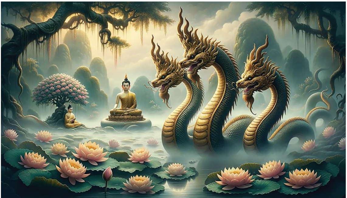
Ảnh minh họa được tạo bởi AI

Tương tự vậy, đó là người tu học pháp, không hiểu pháp, nắm giữ sai pháp.