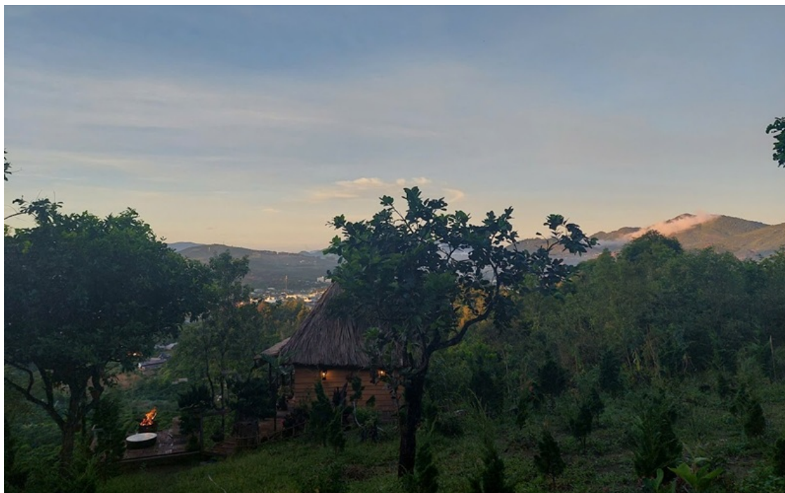
Tùng Lâm Thất bình yên trong sương sớm

Giữa triền đồi lộng gió, một thiền thất nhỏ mang tên Tùng Lâm Thất được dựng lên bên rừng thông. Trước sân là những vườn ươm sơn tùng non. Những cây tùng ấy rồi sẽ tiếp tục được mang đi trồng trên đất đỏ bazan Phương Bối khi đủ lớn để chịu được gió núi và sương lạnh cao nguyên. Có lẽ, việc chọn cây sơn tùng cũng mang theo một ý nghĩa riêng, biểu tượng cho sự thanh cao, bền bỉ và can trường giữa cuộc đời nhiều biến động.