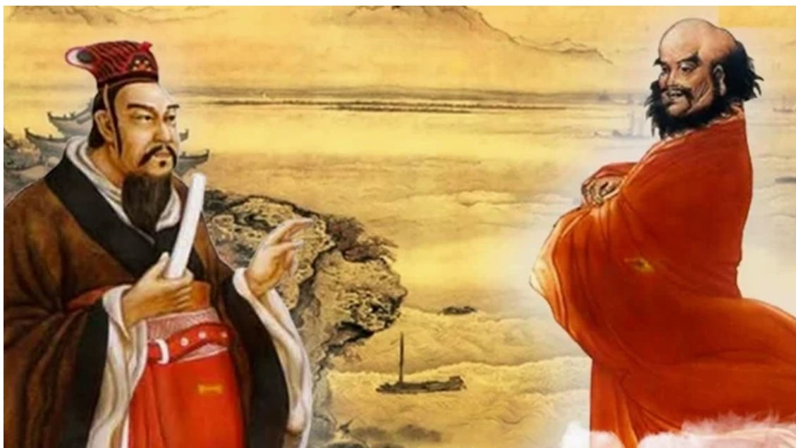
Hình ảnh minh họa Vua Lương Võ Đế và Tổ Bồ Đề Đạt Ma (sưu tầm)

Thời gian sau đó, có người đem sự việc này thưa hỏi Lục Tổ Huệ Năng và được Lục Tổ dạy như sau: Quả thực là không có công đức gì cả. Vua Lương Võ Đế vì không biết Chính Pháp, nên lầm lẫn hai chữ " CÔNG ĐỨC " và " PHÚC ĐỨC "! Nghĩa là cất hàng trăm ngôi chùa, độ tăng chúng tu hành rất đông, thiết trai cúng dường, bố thí, đúc chuông, tạo tượng, ấn tống kinh sách, chỉ là những việc làm " bên ngoài ", có ích lợi cho mọi người, những việc làm cầu phúc, nên gọi là phúc đức.