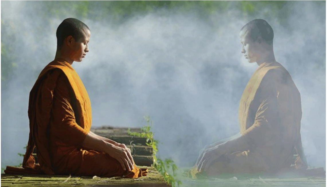
Ảnh mang tính chất minh họa (st)

Ví dụ: Nuôi dạy con cái tử tế, đóng góp xây cầu, trường học, hoặc hỗ trợ người nghèo khó. Kết quả: Tăng trưởng sự thịnh vượng, an lành trong hiện tại hoặc đời sau, tạo nền tảng cho một cuộc sống hạnh phúc hơn.