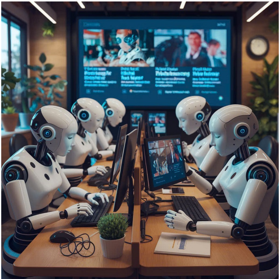
Hình minh họa.

Khi sử dụng AI để tạo ra hình ảnh, phóng viên cần đưa vào đó sự sáng tạo và cảm xúc cá nhân. Việc này giống như thực hành chính niệm: tập trung vào mục đích thiện lành và không để bản thân bị cuốn vào những lợi ích trước mắt.