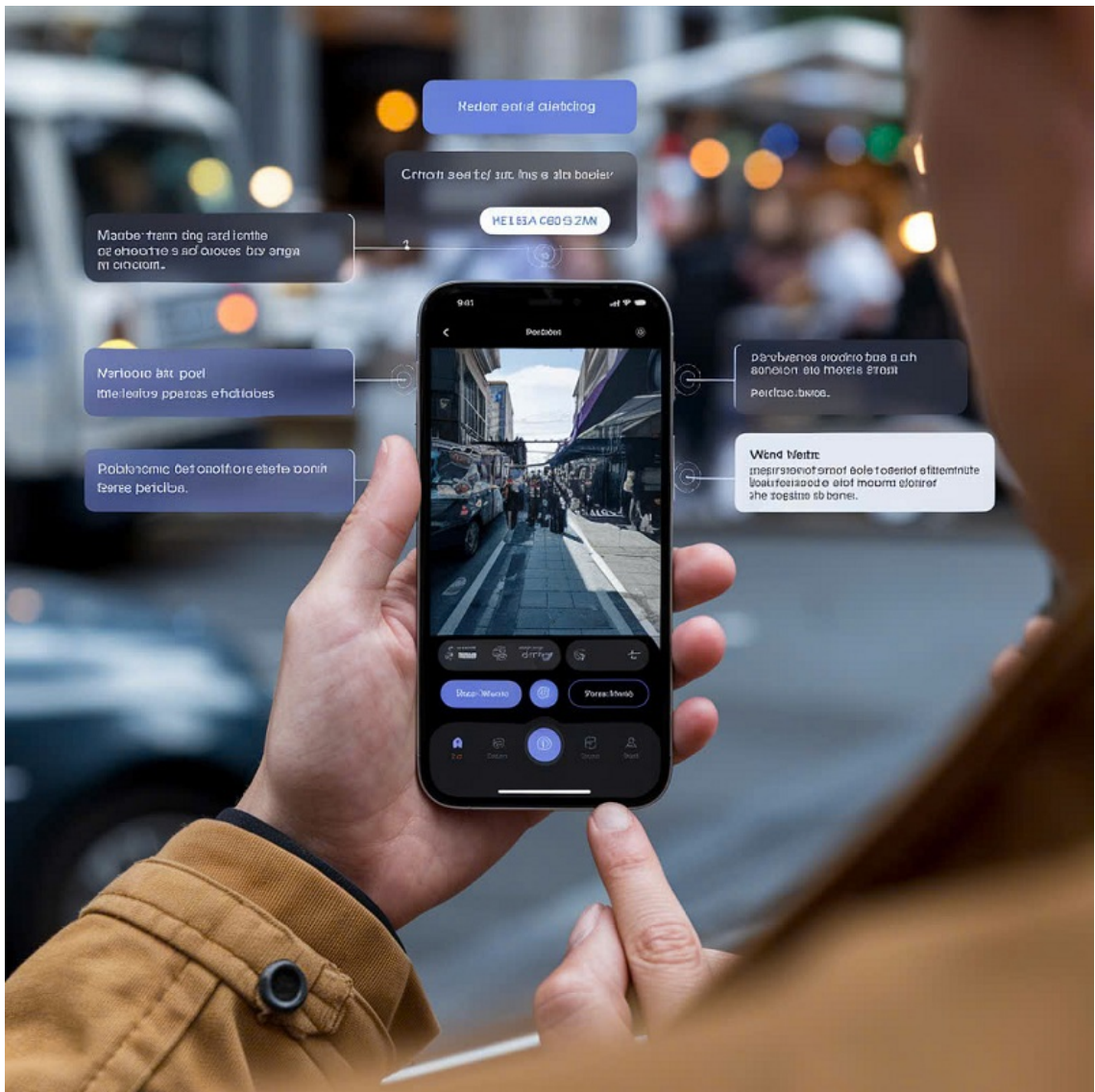
Hình minh họa (AI - Tạp chí Nghiên cứu Phật học).

Tuy nhiên, trong thời đại công nghệ số, khi AI (trí tuệ nhân tạo) trở thành công cụ đắc lực, vai trò của phóng viên ảnh đang thay đổi sâu sắc. Từ những chiếc máy ảnh cơ truyền thống đến máy ảnh kỹ thuật số hiện đại, rồi cả smartphone có chức năng chụp ảnh chuyên nghiệp, giờ đây AI còn mở ra khả năng sáng tạo vượt xa trí tưởng tượng của con người.