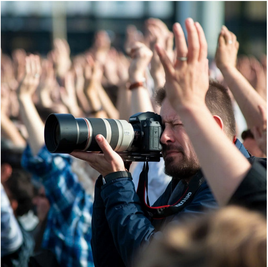
Hình minh họa (AI - Tạp chí Nghiên cứu Phật học).