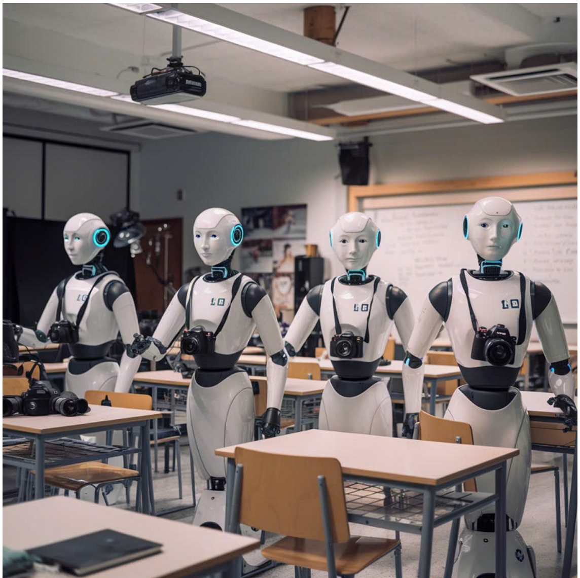
Hình minh họa (AI - Tạp chí Nghiên cứu Phật học).

Phật giáo dạy rằng, mọi công cụ đều là phương tiện, không phải cứu cánh. Nếu không giữ được chính niệm, người sử dụng dễ trở thành nô lệ của chính những phương tiện mà mình tạo ra. Điều này cũng đúng trong nghề phóng viên ảnh: AI có thể làm mất đi cá tính và sáng tạo, nếu chúng ta phó mặc toàn bộ công việc cho nó.