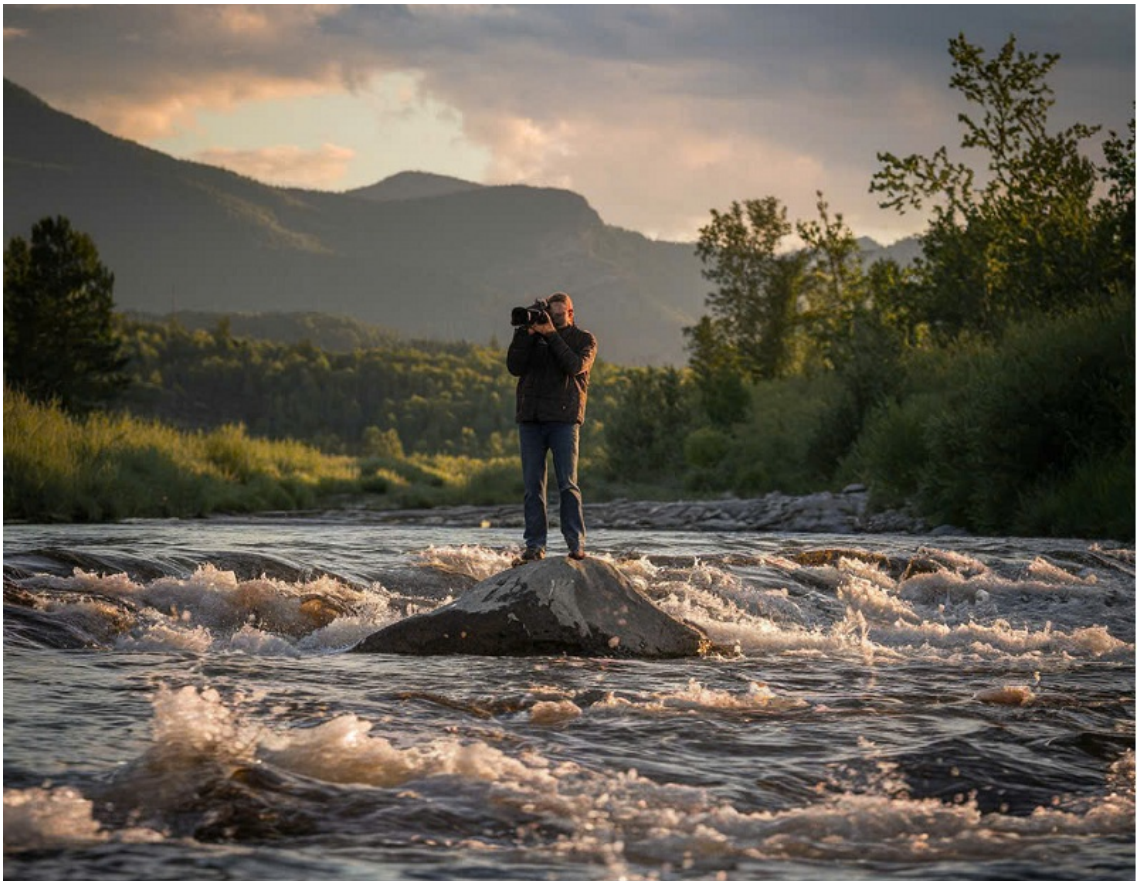
Hình minh họa (AI - Tạp chí Nghiên cứu Phật học).

Khi AI thực hiện ngày càng nhiều tác vụ như tìm kiếm, chỉnh sửa, thậm chí sáng tạo hình ảnh, người phóng viên có thể dễ dàng rơi vào trạng thái “robot hóa”. Điều này đi ngược lại tinh thần Phật giáo, vốn khuyến khích con người luôn giữ tâm sáng suốt và chủ động trong mọi hoàn cảnh.