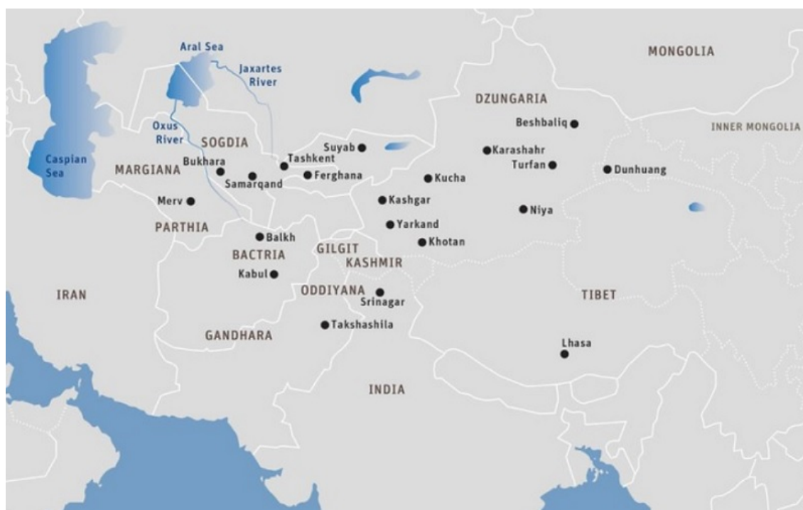
Bản đồ 2: Trung Á truyền thống

* Mông Cổ (Mongolia) là quốc gia nội lục tại Trung Á, giáp Nga ở phía bắc và Trung Quốc ở phía nam. Nổi tiếng với lối sống du mục, quốc gia này có diện tích 1.565.656 km 2 nhưng dân số chỉ khoảng 3,3 triệu người, sở hữu mật độ dân số thấp nhất thế giới. Thủ đô là Ulaanbaatar.