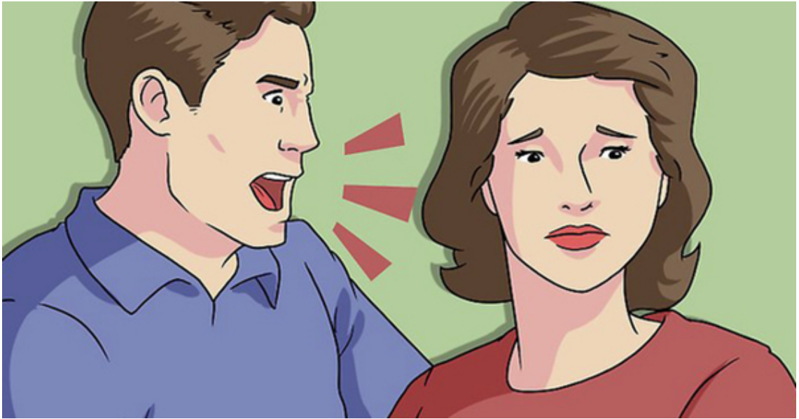
Ảnh minh họa (sưu tầm)