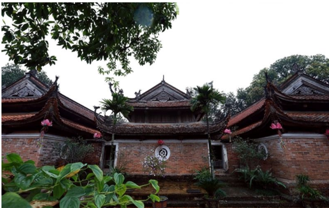
Hình minh họa chùa thời nhà Lê.

Trước tiên, hãy nói về “quân trưởng”. Từ này nên giải thích ra sao? Cần nhắc lại rằng nhà Lê có cách dùng từ không chuẩn mực nên “quân trưởng” có thể đa hàm các ý nghĩa từ trưởng làng, trưởng bản, thủ lĩnh một khu, cho đến vua một cõi. Tuy nhiên, theo cách sử dụng trong văn bản, thì danh nghĩa này được xác lập theo sau sự kiện “kiến bang khởi thổ”, khi mà Lê Hối đã có “sản nghiệp” sau 3 năm, với “con cháu ngày một đông, tôi tớ ngày một nhiều”. “Việc dựng nước mở đất, thực từ ấy mà nên” đẩy ý nghĩa của chữ “quân trưởng” vào một tầm vóc chính trị lớn hơn phạm vi của một thôn trang. Thậm chí, cách nói “từ đây, đời đời làm quân trưởng một miền” còn gợi cho ta thấy quan điểm chính thống và tham vọng quyền lực kết nối đến điều mà triều Hậu Lê về sau kì vọng. Có lẽ nào đại sự thiên hạ đã được tính toán từ ba đời trước thời Lê Lợi? Điều này khó có khả năng vì ta có thể ước tính thời đại của Lê Hối chưa xảy ra việc đô hộ của giặc Minh, nên nhu cầu cho việc phục quốc vẫn chưa xuất hiện. Cách ước tính này chúng ta sẽ làm rõ hơn ở phần sau. Tuy nhiên, vẫn tồn tại khả năng rằng chí lớn đã được nhà này gieo mầm từ rất sớm. Bên cạnh đó, một cách diễn giải đơn giản mà hợp lý hơn là lối diễn đạt mạnh mẽ trên được viết theo quan điểm suy tôn ngược về quá khứ, khi mà Lê Lợi đã lên làm vua, nắm giữ quốc thống.