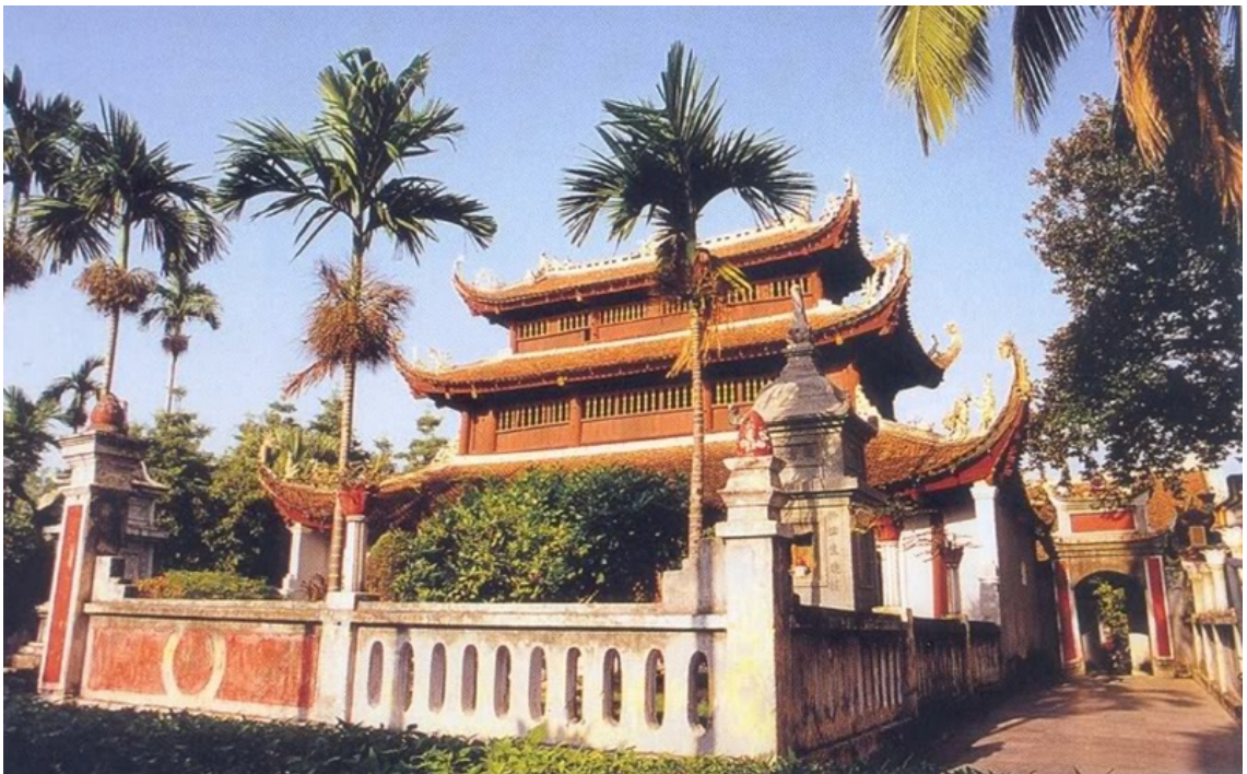
Hình minh họa chùa thời nhà Lê.

Trong bài này, Phan Huy Ích gọi Ngô Thì Nhậm, anh vợ mình, là “sư công”. Ta biết khi này, Ngô Thì Nhậm đã đi tu theo Phật giáo. Thật vậy, trong bài Cảm hứng họa Thị Ngự công chi tác , Ngô Thì Nhậm có họa lại bài thơ trên của Phan Huy Ích, với nguyên dẫn như sau: