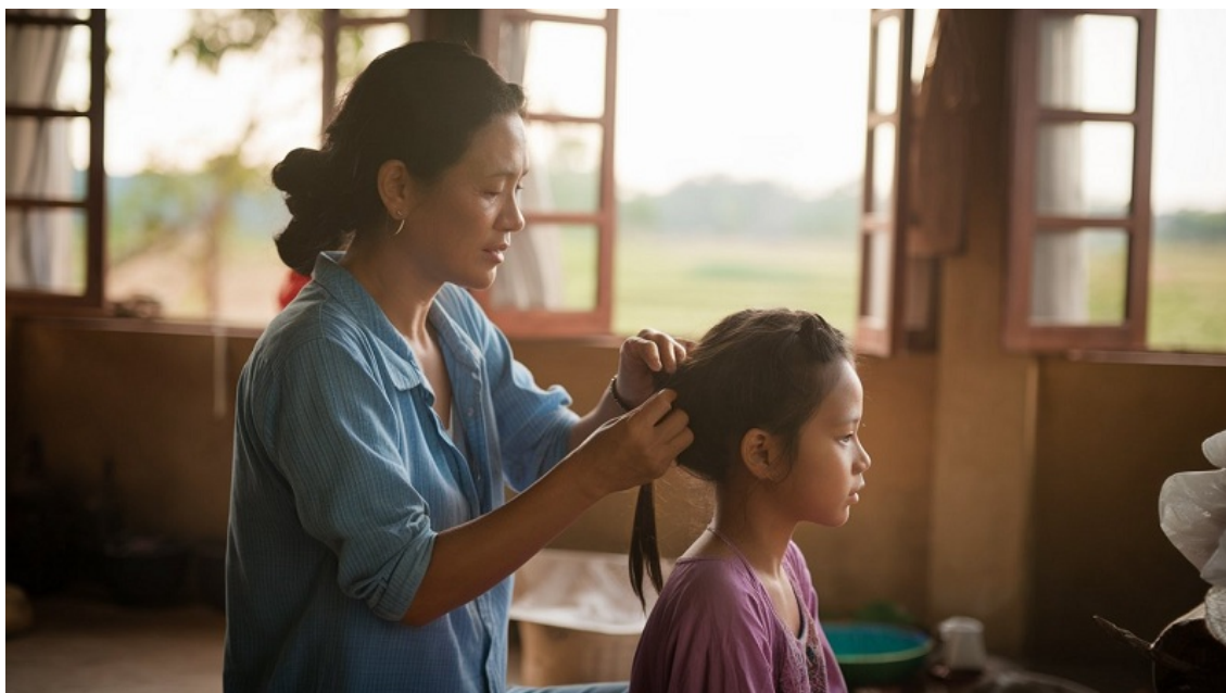
Hình minh họa tạo bởi AI.