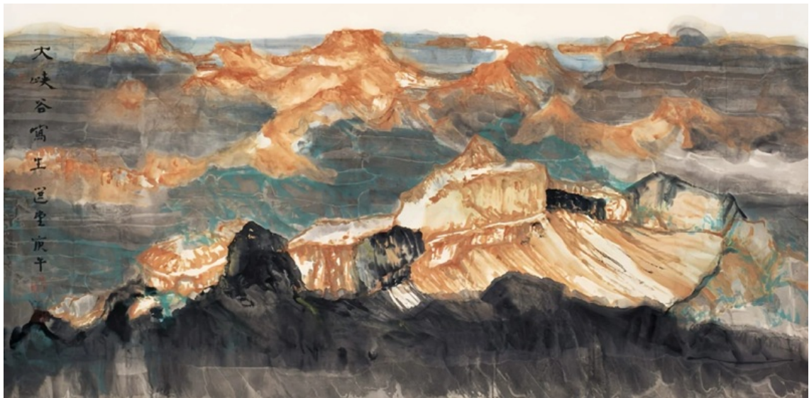
Bản phác thảo Hẻm núi Grand Canyon (1990) được in lại trong cuốn Hẻm núi Kucha (2005).

Ông kế thừa tinh thần của các họa gia như Liang Kai (khoảng 1140-khoảng 1210), Muqi Fachang (khoảng 1210-khoảng 1269) và Yu Jian (thế kỷ 12 đến đầu thế kỷ 13), những người sử dụng những nét bút giản lược nhưng mạnh mẽ để biểu đạt sự giác ngộ. Bên cạnh đó, Jao đã nghiên cứu sâu sắc các tác phẩm Thiền tông của Bada Shanren (1626-1705), học hỏi cách để tinh thần có thể hiện diện trực tiếp trong từng nét vẽ.