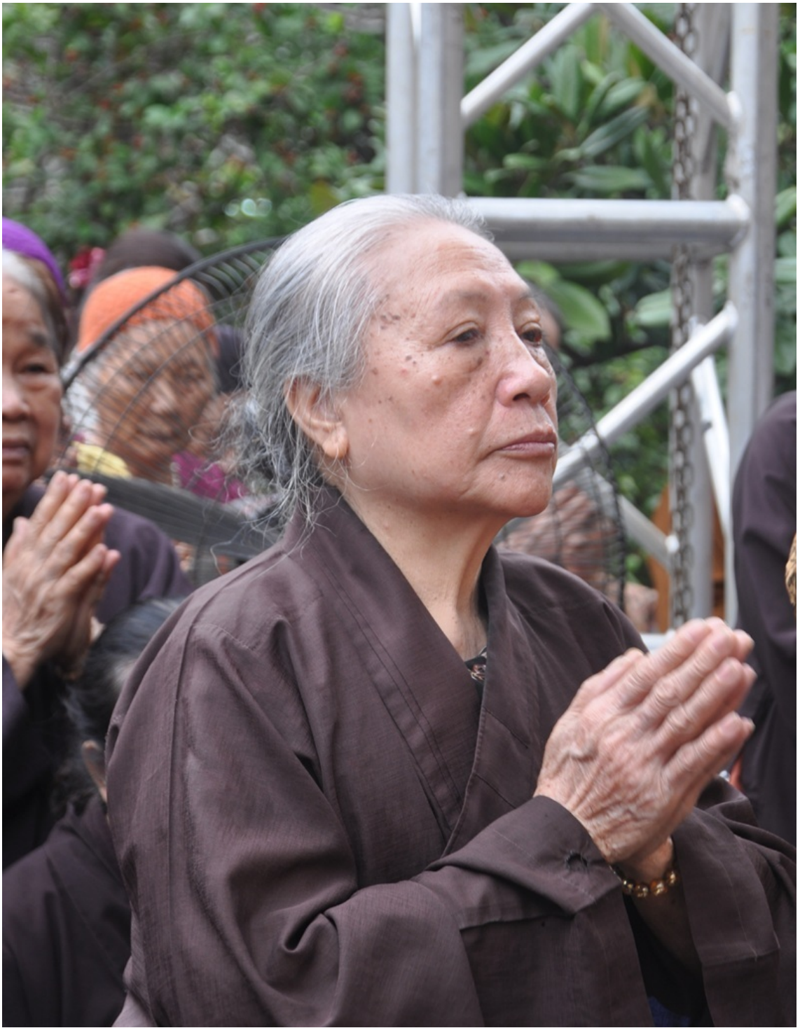
Hình mang tính minh họa.

Nhưng thực tế, tu tập là hành trình dài của sự quay về và chuyển hóa nội tâm. Không ai vừa bắt đầu đã có thể trở thành người hoàn thiện. Điều quan trọng không nằm ở việc thay đổi nhanh đến đâu, mà ở chỗ mỗi ngày có nhận ra những điều chưa tốt nơi chính mình để dần sửa đổi hay không.