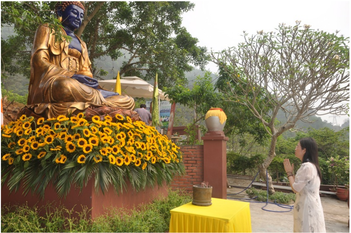
Hình mang tính minh họa.

Người học Phật không phải là người trốn tránh cuộc đời, mà là người học cách đối diện với cuộc đời bằng tâm từ bi và hiểu biết hơn.