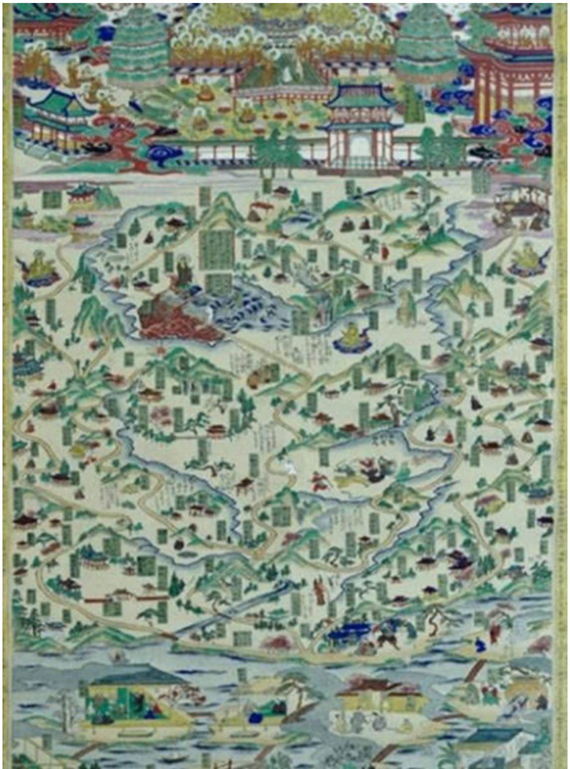
Nhị Hà Bạch Đạo Mạn-đà-la (Họa cảnh Con đường trắng qua hai sông), khoảng năm 1850-1925, Thư viện Quốc gia Israel

Trước hết, cả đạo Phật và Do Thái giáo đều khẳng định rằng việc vi phạm nghĩa vụ thủy chung, phá vỡ các cam kết đạo đức hôn nhân hoặc tiếp cận các mối quan hệ một cách hời hợt là những hành vi phi đạo đức. Ngược lại, các hành vi tình dục theo Tantra (Mật tông Phật giáo) hoặc muttar (hành vi được phép trong luật Do Thái), nếu được thực hiện trong những bối cảnh và giới hạn nhất định, lại được nhìn nhận như một phương thức thực hành tâm linh.