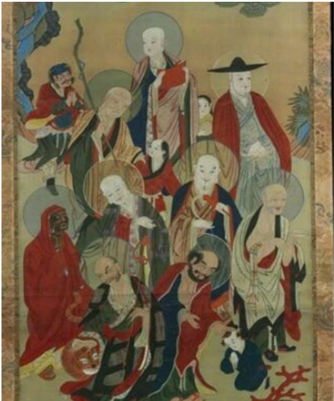
Tranh La Hán, khoảng 1850–1925, Thư viện Quốc gia Israel

Tuy nhiên, trong khi một số phương thức thực hành bề ngoài có xu hướng tương đồng, thì các điểm giao thoa về khía cạnh tâm linh giữa hai hệ tư tưởng này lại mang ý nghĩa và giá trị sâu sắc hơn. Tín đồ Phật giáo hướng tới việc đạt được một nhận thức tối cao về thế giới, tiến trình này có sự tương thích chặt chẽ với các khái niệm trong thần học Do Thái giáo. Cụ thể là sự chuyển dịch từ chochma (tia sáng của sự hiểu biết), qua binah (sự khám phá sâu sắc về bản chất của hiểu biết đó) và đạt tới da'at (một trạng thái tâm thức nâng cao nhằm phản hồi lại tri kiến, tương đương với khái niệm samadhi/Định trong Phật giáo).