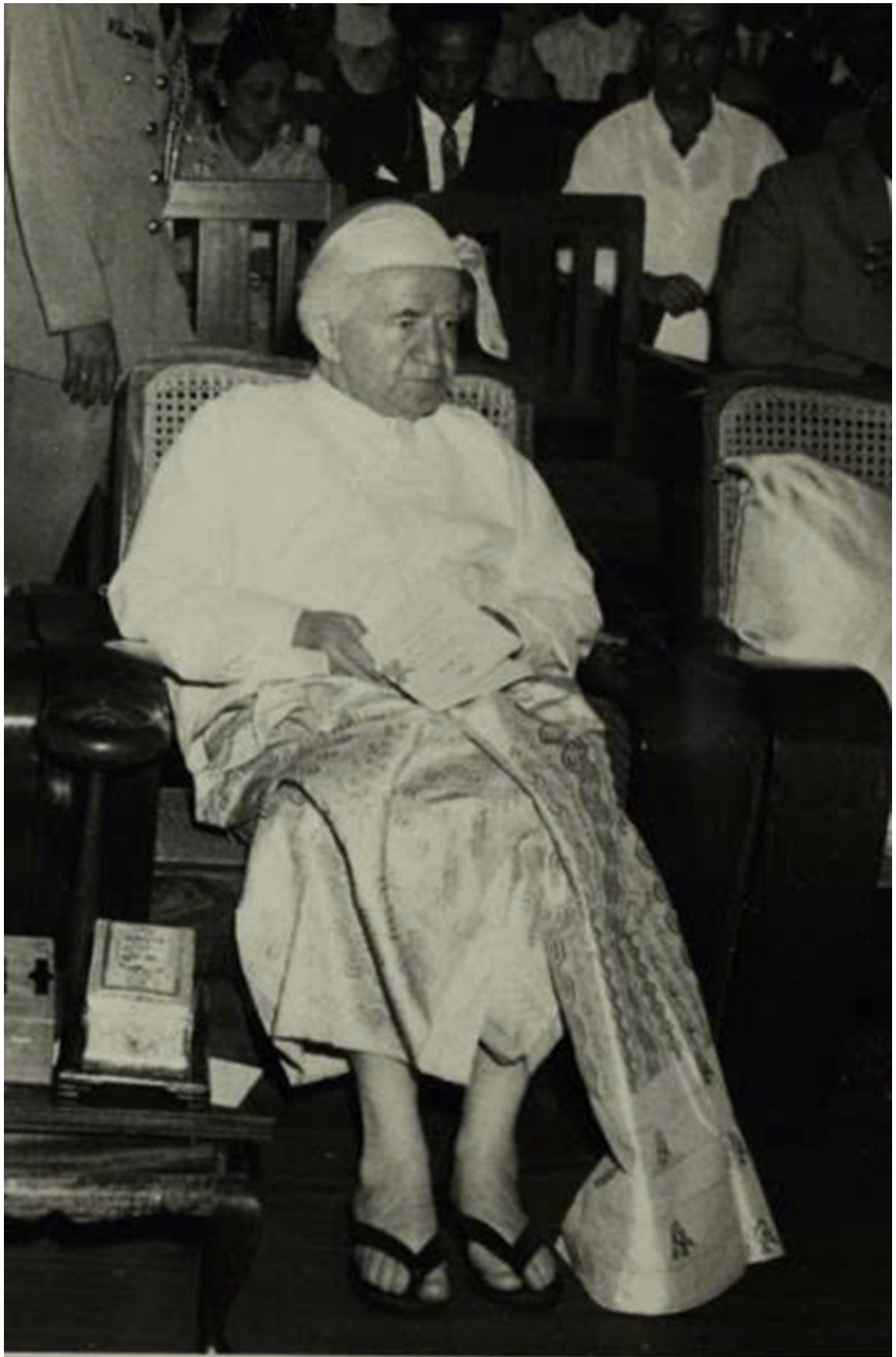
Chuyến thăm của Ben-Gurion tới Miến Điện (nay là Myanmar), năm 1961. Tư liệu này thuộc dự án Mạng lưới Lưu trữ Israel (IAN), được chia sẻ rộng rãi nhờ sự hợp tác giữa Lưu trữ Nhà Ben-Gurion, Bộ Giê-ru-sa-lem và Di sản, cùng Thư viện Quốc gia Israel.