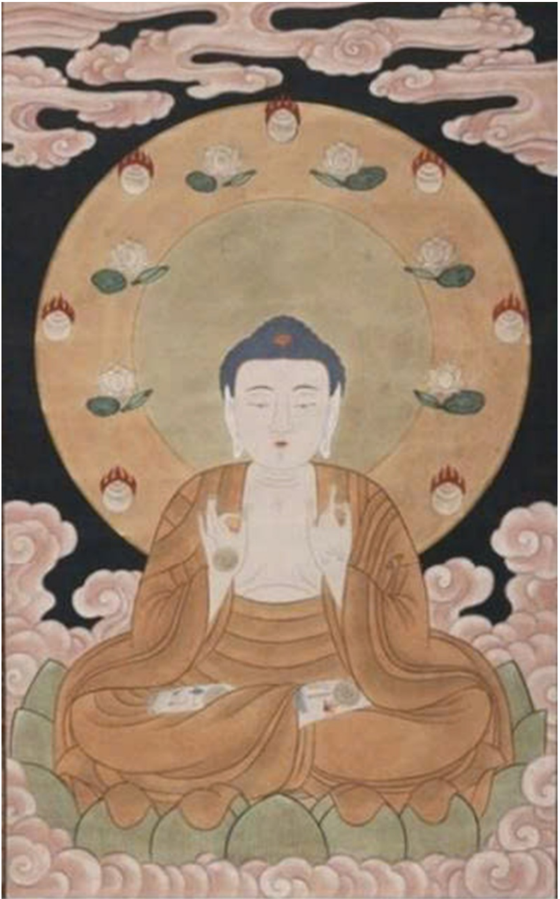
Tranh Đức Phật Thích Ca (Shaka Nyorai), khoảng năm 1850-1925, Thư viện Quốc gia Israel