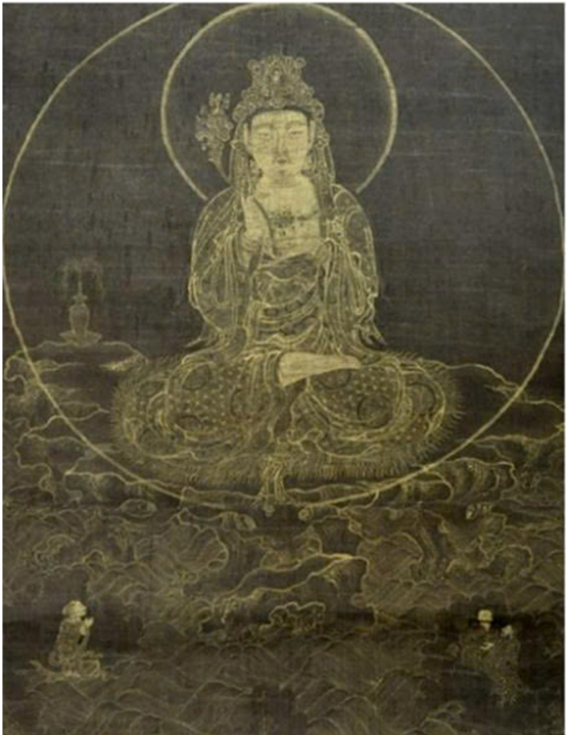
Tranh Đức Quán Thế Âm Bồ Tát, khoảng 1850-1925, Thư viện Quốc gia Israel

Đối với cộng đồng người Do Thái trong thập niên 1960, những người nhận thấy các thực hành tôn giáo truyền thống chưa đáp ứng được nhu cầu định hướng và trải nghiệm tâm linh sâu sắc, hai khuynh hướng tiếp cận chính đã hình thành.