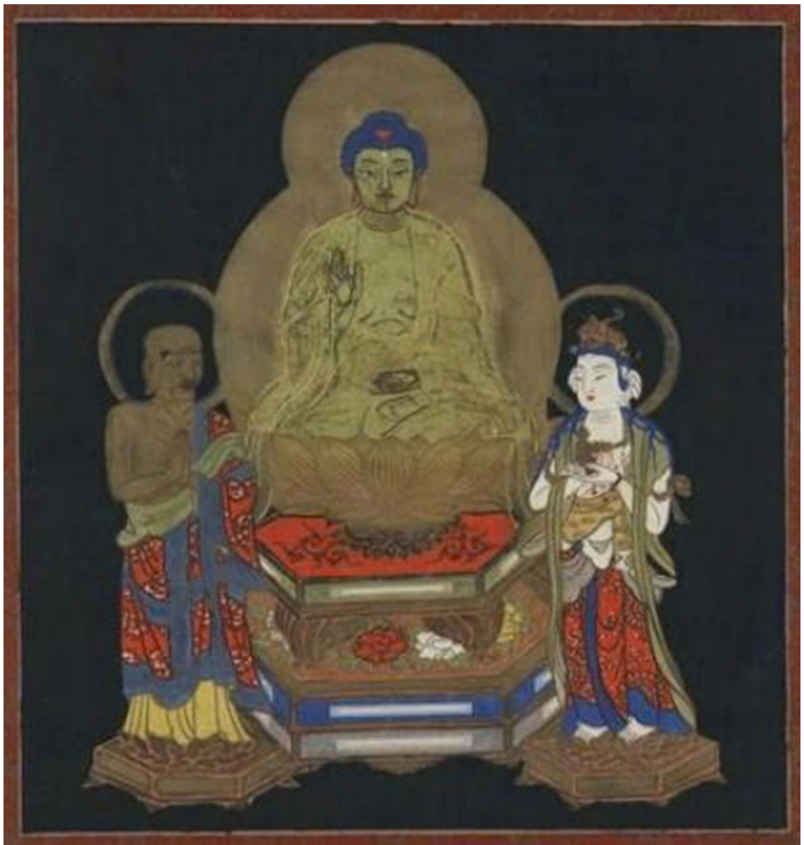
Tượng/Tranh Thích Ca Tam Tôn, khoảng 1850-1925, Thư viện Quốc gia Israel

Trong quá trình ngiên cứu một dự án chuyên sâu về âm lịch, việc tra cứu từ khóa “moon” (mặt trăng) trên hệ thống danh mục trực tuyến của Thư viện Quốc gia Israel đã dẫn đến một phát hiện đặc biệt. Giữa hệ thống tư liệu hình ảnh phong phú, xuất hiện một tác phẩm hội họa có giá trị nghệ thuật cao mang tiêu đề “Thần Kami và các vị Phật tại chùa Đông Đại” (Todaiji) thánh tích danh tiếng thuộc Hoa Nghiêm tông tại thành phố Nara, Nhật Bản.