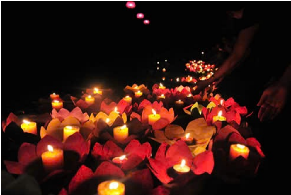
Ảnh được cho là chụp hoạt động ngày lễ Vu Lan được diễn ra tại Thừa Thiên Huế