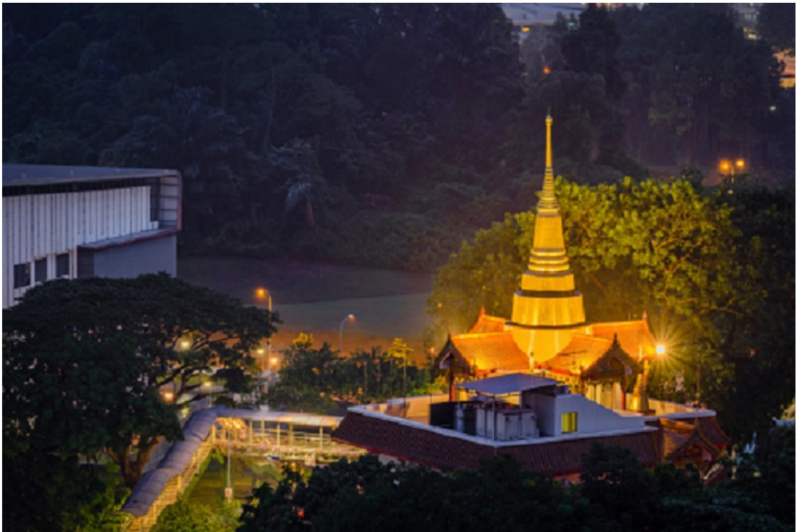
Ảnh chụp ban đêm từ trên cao

Ngôi chùa được thành lập vào những năm 1920, chùa Phật giáo Thái Lan Wat Ananda Metyarama là một trong những ngôi chùa Phật giáo Theravada Thái Lan lâu đời nhất ở Singapore. Bức tranh tường tuyệt đẹp mô tả các địa danh chính của thành phố và hào quang tâm linh của Chùa Phật giáo Thái Lan Wat Ananda là những điểm nhấn chính.