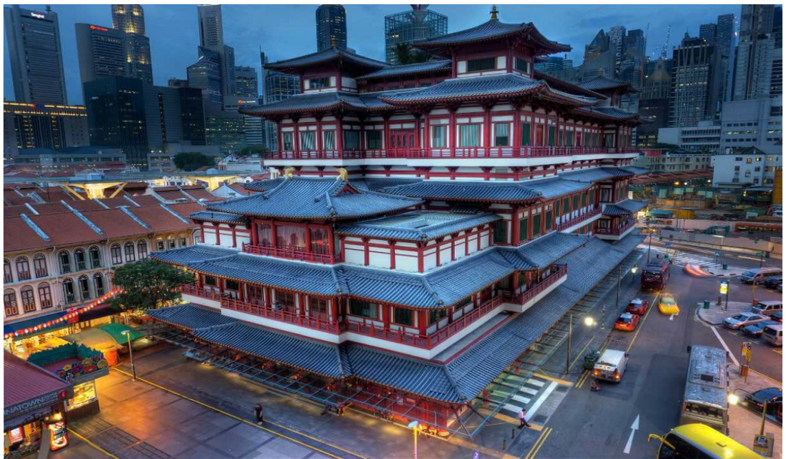
Chùa Răng Phật.

Singapore được đặc trưng bởi nhiều tập tục tôn giáo, tín ngưỡng khác nhau do sự đa dạng về bản sắc dân tộc của người dân đến từ nhiều nơi trên thế giới. Là một quốc gia thế tục, Singapore thường được gọi là “nồi lẩu thập cẩm” bởi nhiều tập tục tôn giáo khác nhau, bắt nguồn từ các giáo phái tôn giáo khác nhau trên khắp thế giới. Với vị thế lịch sử của Singapore là một cảng thương mại và quốc gia thuộc địa Anh, có một thời gian ngắn bị Nhật Bản cai trị trong Thế chiến 2, trải qua nhiều thế kỷ, nhiều tông phái Phật giáo khác nhau từ khắp nơi trên thế giới đã dần dần xuất hiện trên “Đảo quốc sư tử” này.