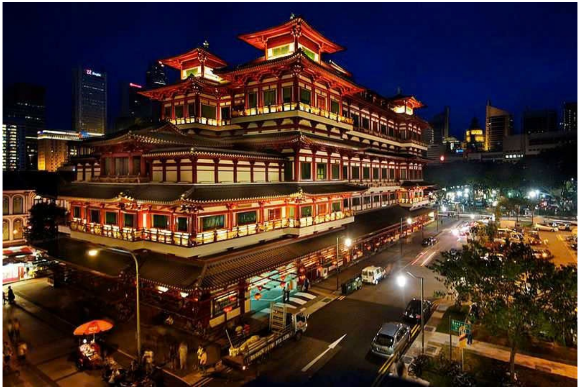
Chùa Răng Phật.

Ngôi Già lam được thiết kế và bài trí theo Mandala, thể hiện quan niệm “Vũ trụ Vạn vật” của Phật giáo và mang đậm nét kiến trúc đời Đường, Trung Quốc. Ngôi tự viện gồm năm tầng nổi và một tầng hầm. Từ ngoài nhìn vào rất ấn tượng bởi vẻ nguy nga tráng lệ và màu sắc nổi bật của một công trình Phật giáo vừa nét cổ điển lại mang tính hiện đại.