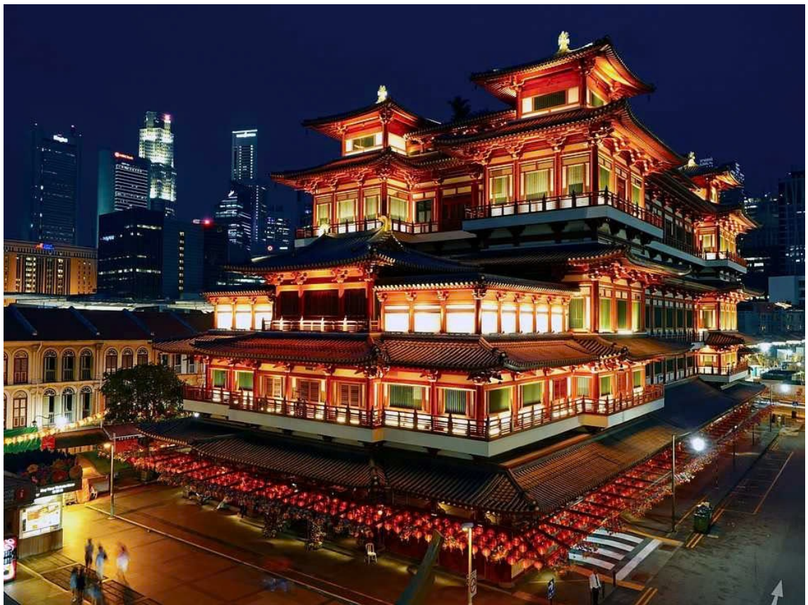
Chùa Răng Phật.