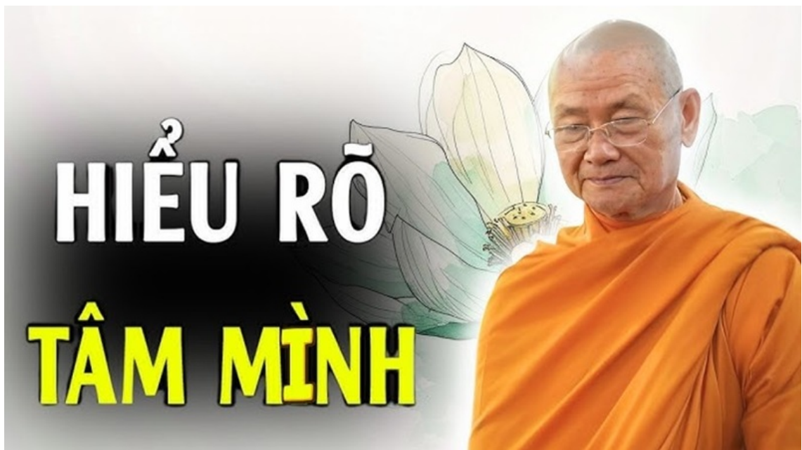
Hình chỉ mang tính minh họa.

Câu kệ đầu tiên của phẩm Song Yếu Kinh Pháp Cú, đức Phật dạy: “Ý dẫn đầu các pháp, ý làm chủ, ý tạo”. Toàn bộ đời sống cá nhân và xã hội đều ít nhiều phản ánh chất lượng của những gì đang diễn ra trong tâm.