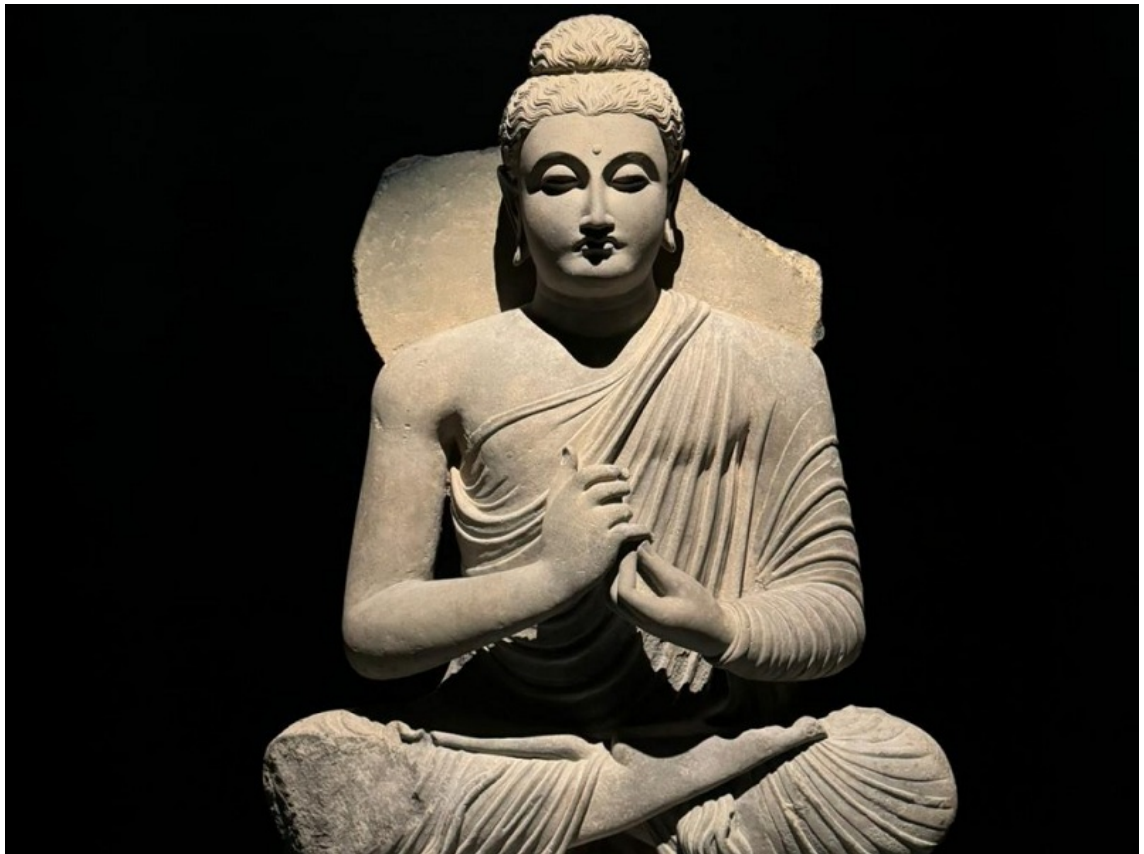
Tượng đức Phật bằng đá phiến xám, Gandhara, thế kỷ thứ 3 sau Công nguyên. Carlton Rochell Asian Art, New York, 2007.

Thứ hai, đức Phật mà chúng ta biết ngày nay vốn là một vị hoàng tử thuộc dòng tộc Shakya của Ấn Độ. Thế nhưng, bức tượng đức Phật đầu tiên được tìm thấy lại mang nhiều nét giống gương mặt Hy Lạp hơn là người Ấn Độ. Điều này đặt ra những câu hỏi thú vị về sự ảnh hưởng của văn hóa Hy Lạp, đặc biệt ảnh hưởng từ thời Alexander Đại đế đối với khu vực này.