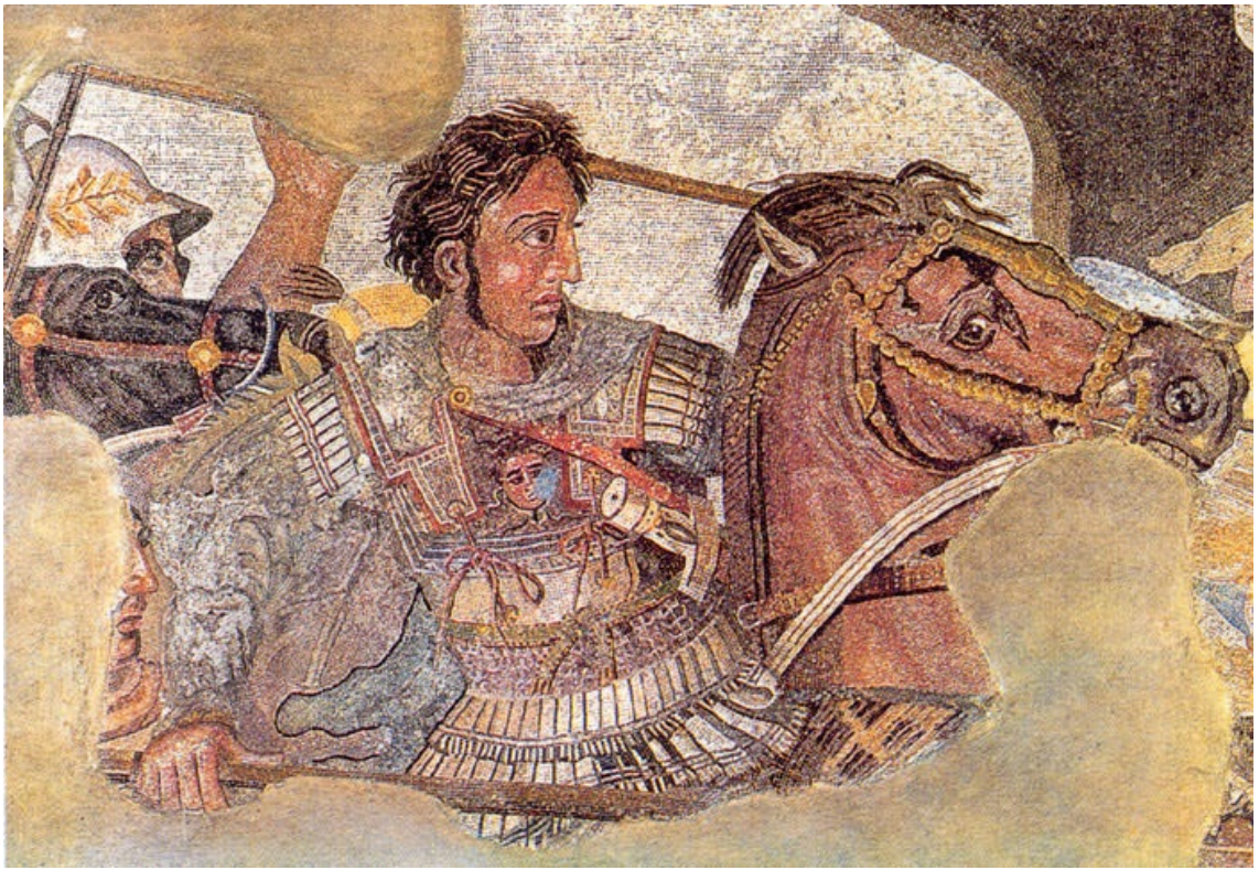
Một hình ảnh Alexander trong bức tranh khảm Alexander, khoảng năm 120-100 TCN, được khai quật ở Pompeii, Ý.