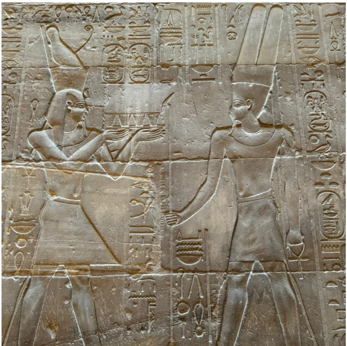
Phù điêu Alexander Đại đế đang dâng lễ vật cho Amun-Ra tại Đền Luxor, Ai Cập

Sự giao thoa văn hóa này tiếp tục phát triển dưới thời các vị vua kế nhiệm của Alexander. Các vị vua Hy Lạp - Ấn Độ, theo gương các vị vua thành bang Hy Lạp, trở thành những nhà bảo trợ cho nghệ thuật, duy trì và phát huy những đặc điểm nghệ thuật độc đáo của khu vực.