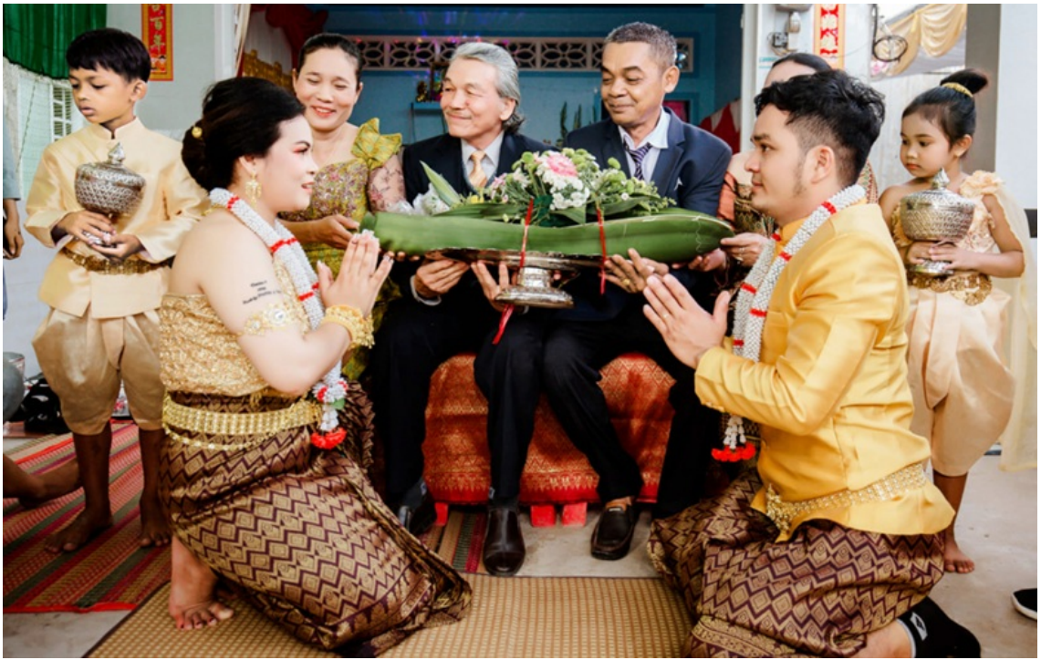
Hình minh họa.

Trong nhận thức truyền thống, mỗi gia đình luôn là một phần của phum sóc.