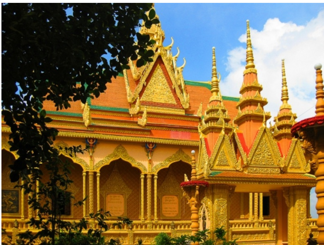
Hình minh họa.

Trong lịch sử hình thành và phát triển của cộng đồng Khmer Nam Bộ, chùa vừa là nơi thực hành tín ngưỡng Phật giáo Nam tông, vừa là trường học truyền thống, trung tâm văn hóa và không gian lưu giữ tri thức dân tộc. Nhiều giá trị văn hóa, đạo đức và phong tục tập quán của người Khmer được bảo tồn, trao truyền và tái tạo thông qua các hoạt động của nhà chùa.