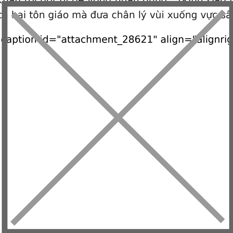
Hình ảnh chỉ mang tính chất

[caption id="attachment_28621" align="alignright" width="400"]