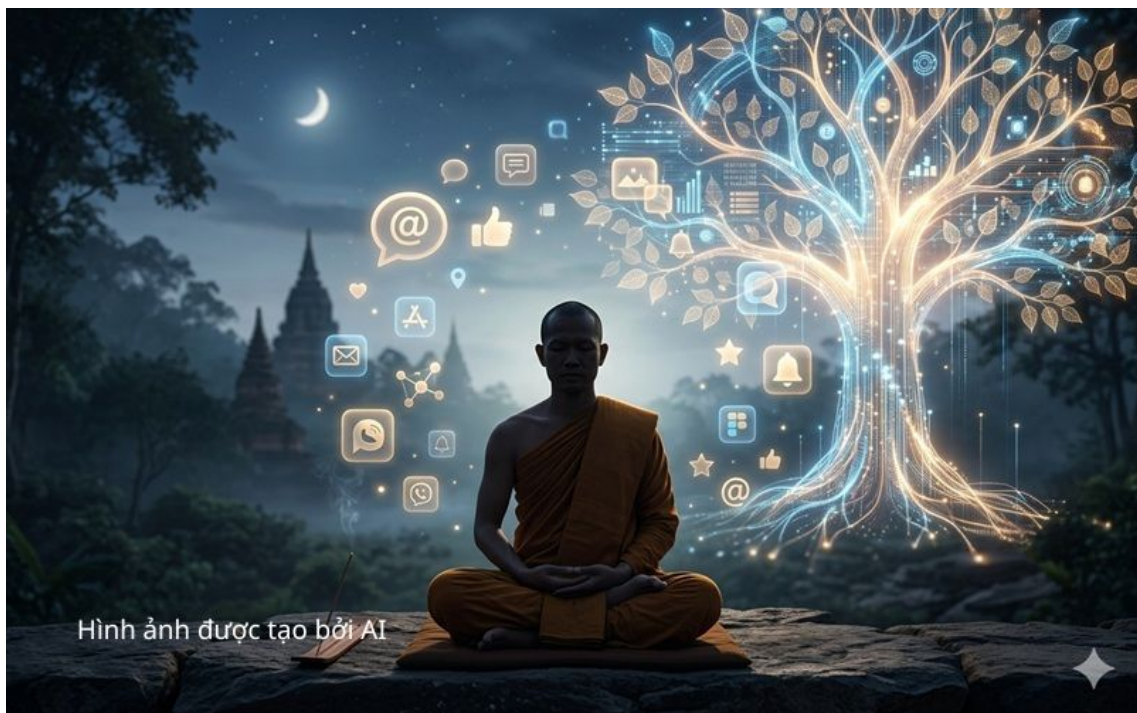
Hình ảnh được tạo bởi AI

Thứ ba, “chính niệm” trong sử dụng truyền thông có thể được xem như một nguyên tắc tự điều chỉnh (self-regulation) đối với chủ thể truyền thông. Trong bối cảnh các nền tảng số vận hành dựa trên cơ chế tối đa hóa sự chú ý, người làm truyền thông dễ bị cuốn vào việc theo đuổi các chỉ số định lượng như lượt xem, lượt tương tác, từ đó làm lệch hướng mục tiêu hoằng pháp. Việc thực hành chính niệm cho phép chủ thể duy trì sự tỉnh thức trước động cơ hành động của chính mình, nhận diện và vượt qua những cám dỗ của “truyền thông vị lợi”, để giữ vững định hướng phục vụ chân lý và lợi ích lâu dài của cộng đồng.