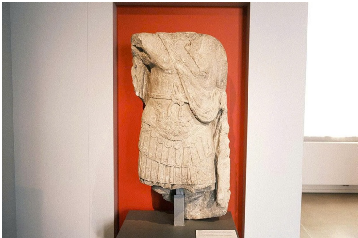
Tác phẩm điêu khắc mang đậm dấu ấn thời kỳ La Mã (thế kỷ 1 sau Tây lịch) hiện đang được lưu giữ tại Bảo tàng La Mã-Đức (Cologne, Đức) mô tả hình ảnh một sĩ quan cấp cao đầy quyền uy. Tượng nổi bật với các chi tiết chạm khắc áo giáp công phu, dải băng tướng quân

Nền văn minh Hy Lạp - La Mã là sự kết hợp hoàn hảo giữa tính thực dụng của người La Mã và chủ nghĩa duy tâm của người Hy Lạp. Sự giao thoa rực rỡ này đã đặt nền móng vững chắc cho văn hóa và nghệ thuật các thời kỳ tiếp theo, tiêu biểu như thời kỳ Trung cổ Cơ đốc giáo.