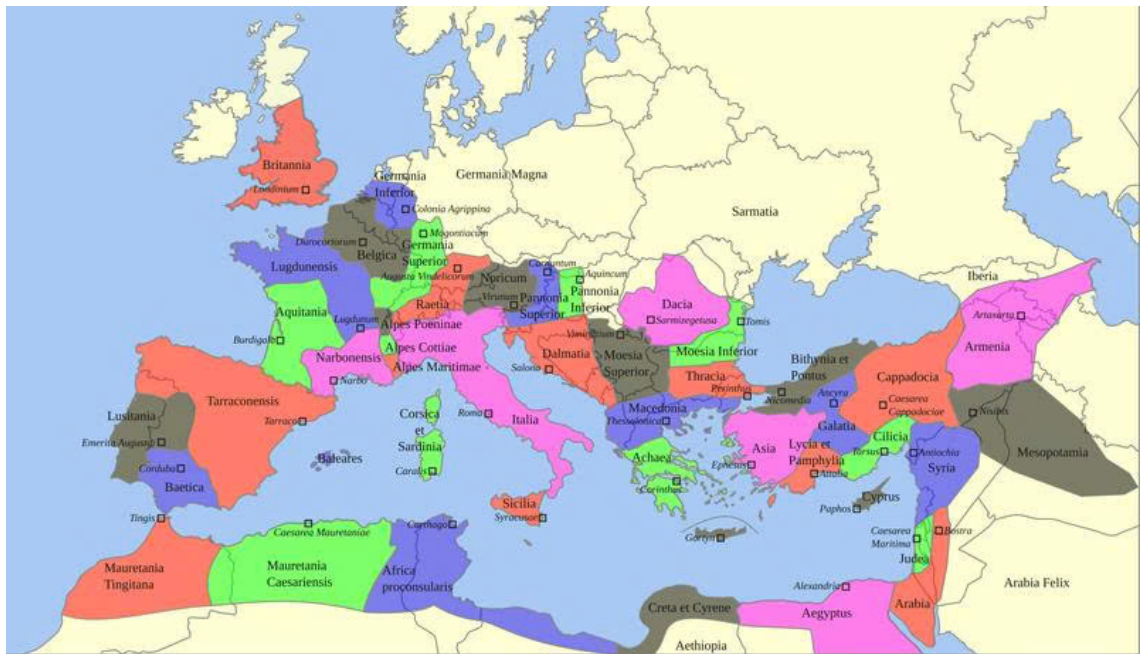
Bản đồ Đế chế La Mã và các tỉnh của nó vào thời kỳ bành trướng mạnh mẽ nhất dưới thời Hoàng đế Trajan (115-117).

Nền văn minh Hy Lạp - La Mã là sự kết hợp hoàn hảo giữa tính thực dụng của người La Mã và chủ nghĩa duy tâm của người Hy Lạp. Sự giao thoa rực rỡ này đã đặt nền móng vững chắc cho văn hóa và nghệ thuật các thời kỳ tiếp theo, tiêu biểu như thời kỳ Trung cổ Cơ đốc giáo.