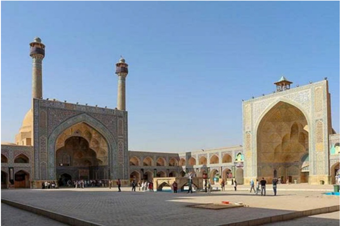
Nhà thờ Hồi giáo Jameh của Isfahan, Iran.

Nếu mô tả này chính xác, có thể phản ánh sự ảnh hưởng của vị tu sĩ Phật giáo trụ trì trước đây đã cải đạo sang Hồi giáo. Hoặc có lẽ đây chỉ đơn thuần là sự hiểu lầm về một phong tục hoàn toàn thuộc về Phật giáo?