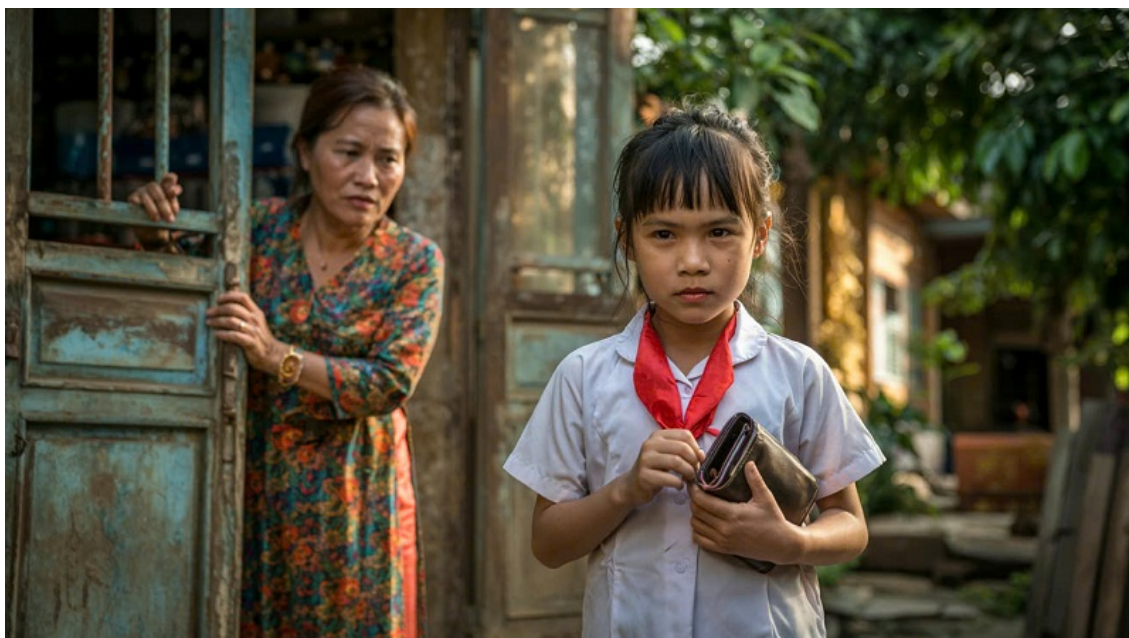
Hình minh họa tạo bởi AI.