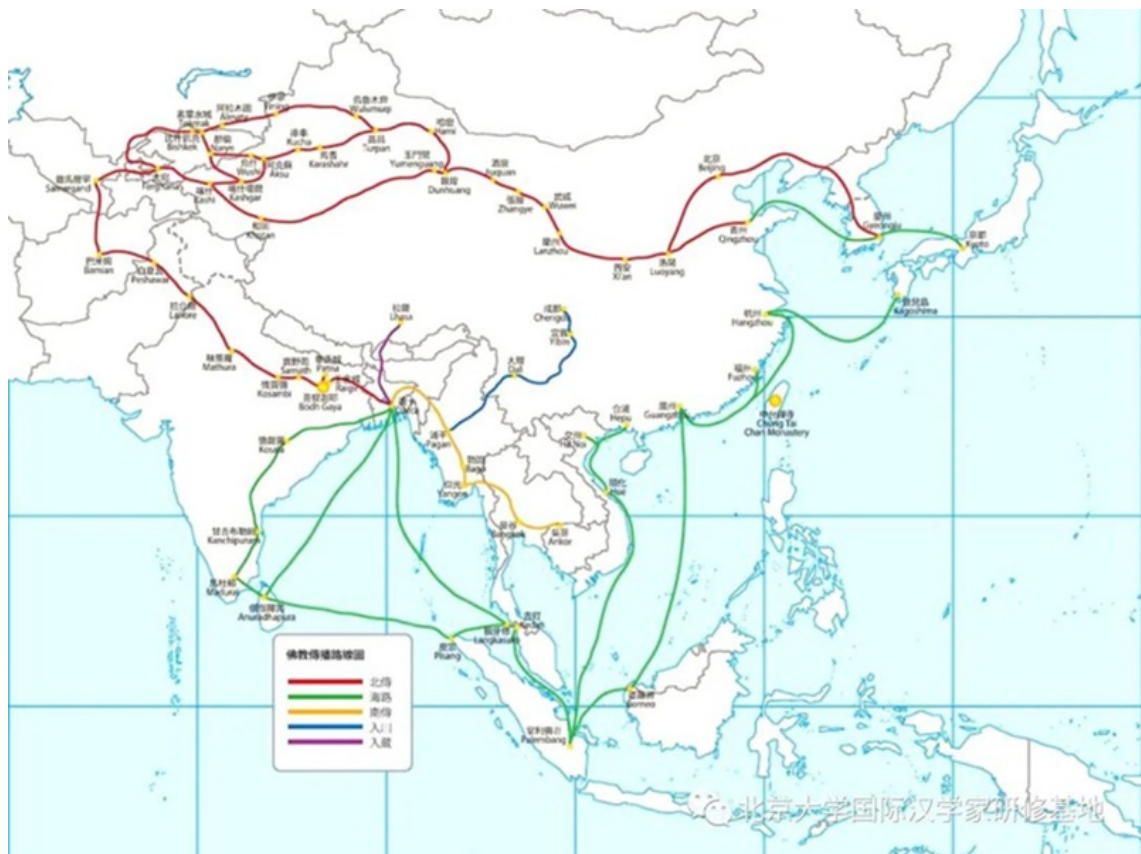
Bản đồ giao thông vận tải ở các vùng phía Tây và Biển Đông

Về sau, vào năm Thiên Khải thứ 7 (Đinh Mão - 1627) - năm cuối triều đại Thiên Khải của Minh Hy Tông - Ngài rời vùng Lĩnh Nam (khu vực rộng lớn bao gồm miền Bắc Việt Nam ngày nay và các tỉnh Quảng Đông, Quảng Tây, Hải Nam của Trung Hoa) để đến tham học với Thiền sư Bác Sơn (hiệu Vô Dị Đại Hy, 1575-1630). Thiền sư Bác Sơn là một vị cao tăng danh tiếng thuộc tông Tào Động đời Minh, nổi bật với công trình chỉ dẫn thực hành thiền tông kinh điển là tác phẩm “Tham Thiền Cảnh Ngữ” (參禪景語). Tại đây, Ngài đã được truyền tâm ấn và trao phó trọng trách kế thừa. Từ đó, Ngài hội tụ và đúc kết nên đại thành tựu của cả ba học phái: Thiền tông, Tịnh độ tông và Luật tông.