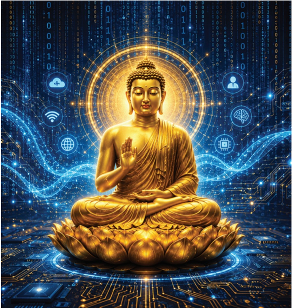
Hình ảnh được tạo bởi AI

Tinh thần ấy khiến đạo Phật có khả năng thích ứng mạnh mẽ với những biến đổi của lịch sử.