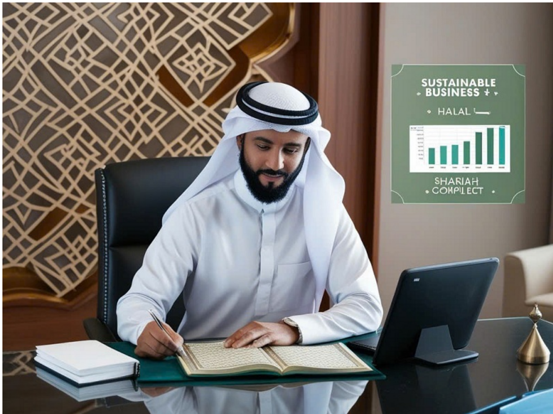
Hình ảnh được tạo bởi công nghệ AI.

Halal và Haram: Đạo đức kinh doanh Hồi giáo nhấn mạnh sự phân biệt giữa “Halal” (được phép) và “Haram” (bị cấm). Kinh Quran cấm các giao dịch liên quan đến lãi suất (riba), cờ bạc, rượu, thịt lợn và các hoạt động không hợp pháp khác.