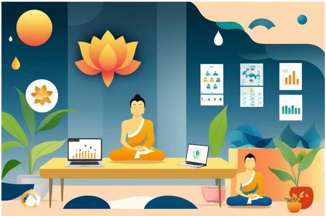
Hình ảnh được tạo bởi công nghệ AI.