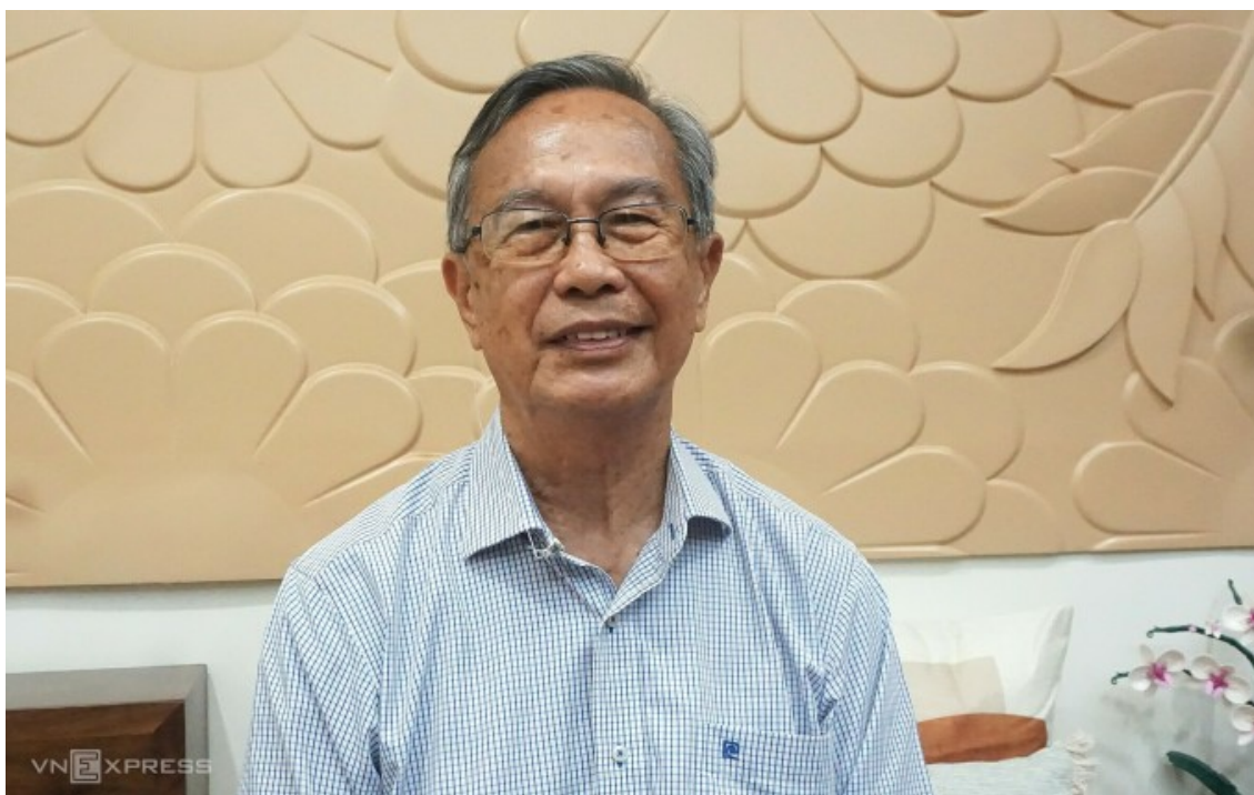
GS TS Lê Ngọc Thạch

Trong cơn bão lũ, cộng đồng mạng chú tâm đến nghĩa cử cao quý của một trí thức với bà con miền Bắc bị bão số 3. Ông đã mang số tiền tiết kiệm chắt chiu qua bao năm tháng dạy học, viết sách để nhờ một nhật báo gửi cho bà con ngoài ấy, số tiền đó là 1 tỷ đồng. Ông nói: "Đóng góp một tỷ đồng với một cá nhân có thể là lớn nhưng so với mất mát của đồng bào ngoài ấy chẳng là bao" . Ông đã về hưu mấy năm song vẫn đang thỉnh giảng tại Đại học KHKHTN Tp.HCM, một trí thức có tên tuổi: GS TS Lê Ngọc Thạch.