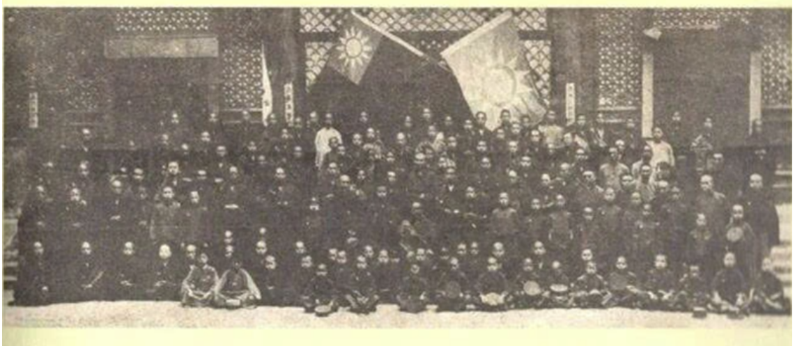
Chụp ảnh lưu niệm Tứ chúng Bắc Bình chào đón Đại sư Thái Hư tại chùa Bách Lâm vào tháng 5 năm 1930.

Sức ảnh hưởng từ phong trào giáo dục của Đại sư còn lan tỏa sâu rộng khi học tăng tốt nghiệp từ các trường này đã trở thành lực lượng giảng sư nòng cốt tại nhiều cơ sở Phật học khác như: Trúc Lâm, Ngọc Sơn, Pháp Giới, Quang Cống, Tê Hà, Hoàng Từ và Chúc Thánh.