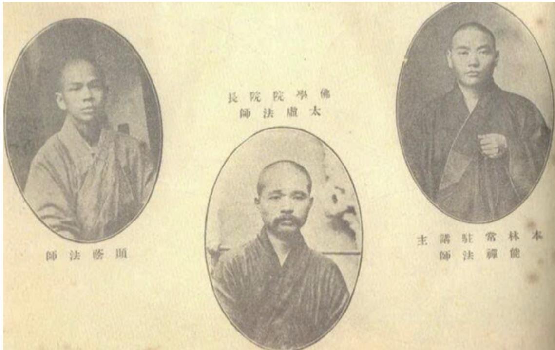
Chân dung Đại sư Thái Hư thời kỳ đảm nhiệm chức vụ Viện trưởng Phật học viện Vũ Xương năm 1923.

khai của Phật giáo và giáo dục Tăng-già' ( ), 'Từ giáo dục phổ quát tại Trung Hoa bàn về giáo dục tăng sĩ' ( ) (1931), và 'Sự nguy vong của giáo dục Tăng-già hiện đại cùng tiền đồ Phật giáo' ( ) (1932).