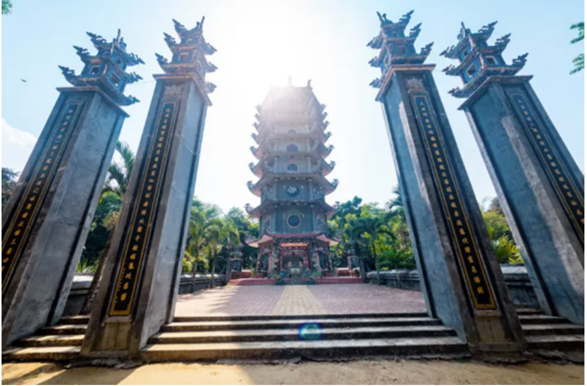
Tòa bửu tháp uy nghi trong khuôn viên chùa Thiên Ân.

Về kiến trúc, chùa Thiên Ân gây ấn tượng bởi những họa tiết cầu kỳ hình lưỡng long chầu nguyệt cùng cuốn thư và hệ thống câu đối được trang trí ngay cổng ra vào. Phía trên cánh cổng - gác tam quan được đặt bức tượng thần Hộ pháp bảo vệ chùa. Bước tiếp vào trong là hai dãy tượng La Hán ở hai bên những bức tượng Phật.