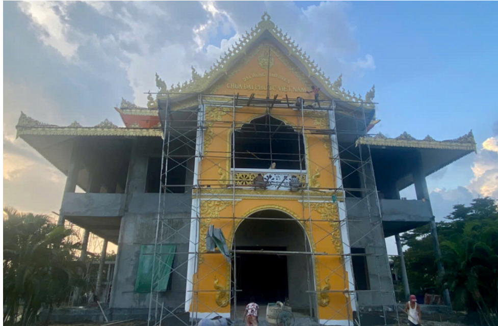
Chùa Đại Phước