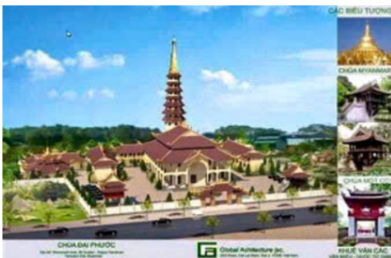
Mô hình chùa Đại Phước

Sư Ngọc đã nhiệt tình giúp đỡ các tăng, ni sinh Việt Nam về mọi mặt từ những bước đầu bỡ ngỡ khi tham gia học Phật tại đất nước quốc giáo này và cũng chính từ nhu cầu cần thiết phải có nơi dừng chân dành cho tăng sinh Việt Nam có nơi lưu trú khi qua Myanmar tu học và nhu cầu cần có nơi làm trung tâm hành hương tâm linh dành cho Phật tử Việt Nam đang sinh sống tại Myanmar và các phái đoàn Phật tử Việt Nam đến du lịch đất nước chùa tháp này, nên sư Thiện Ngọc đau đáu trong lòng về việc nên hay chẳng lập một ngôi già lam phong cách Việt Nam tại đây.