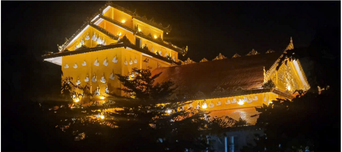
Chùa Đại Phước

Dự án xây dựng chùa đã được khởi động từ năm 2015 nhưng việc xây dựng chùa Đại Phước giữa chừng phải ngưng lại vì sự ra đi đột ngột do bệnh duyên của TT.Thích Thiện Minh, Viện chủ 4 chùa Việt Nam trực thuộc Giáo hội Phật giáo Việt Nam tại hải ngoại: chùa Đại Lộc (Ấn Độ); chùa Đại Phước (Myanmar); chùa Đại Thọ (Phần Lan); chùa Đại Hạnh (Cambodia) và ngoài ra Ngài còn là viện chủ một số tự viện thuộc Phật giáo Nam tông trong nước.