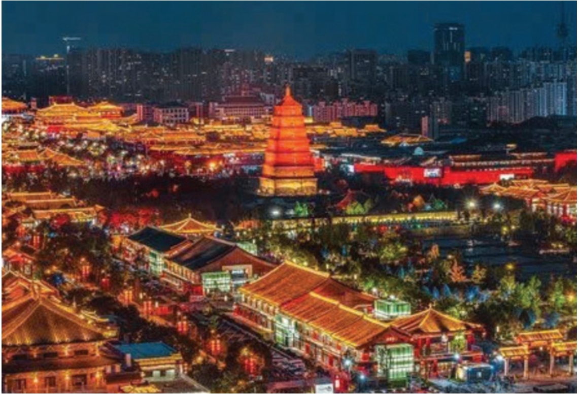
Tây An, Trung Quốc.

Trong tiến trình tu học Phật giáo, kinh điển (pháp bảo) giữ vai trò nền tảng trong việc hình thành chính kiến, là kim chỉ nam cho con đường tu tập.