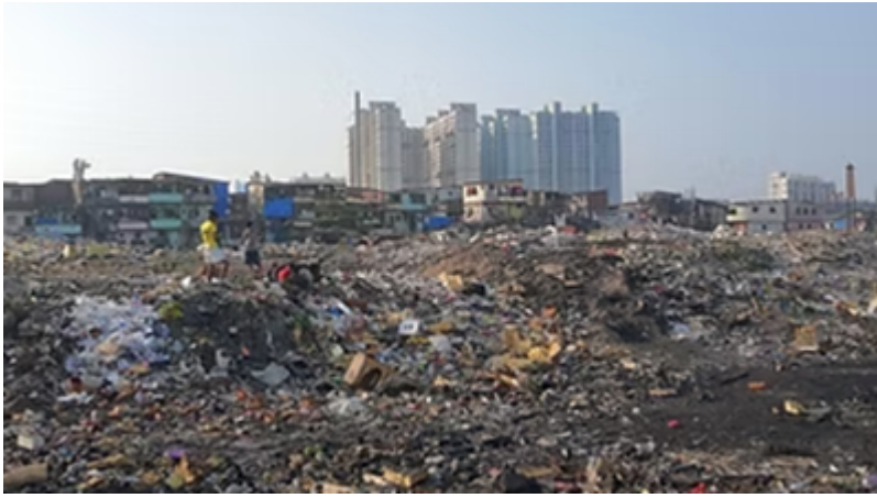
Bãi chôn lấp ở Deonar (Mumbai)