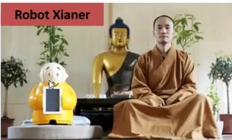
Robot Xianer Master Xianfan and his robot monk Xianer. Photograph: Kim Kyung-Hoon/Reuters [ https://www.theguardian.com/world/2016/apr/26/robot-monk-to-spread-buddhist-wisdom-to-the-digital-generation ]