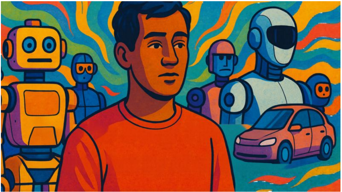
Hình mang tính minh họa.

Khi AI ngày càng tinh vi trong việc phân tích hành vi và sở thích người dùng, mức độ cá nhân hóa này sẽ còn mạnh mẽ hơn nữa. Nếu mạng xã hội từng là chất xúc tác cho chủ nghĩa cá nhân, thì AI có nguy cơ làm cho xu hướng ấy trở nên gây nghiện hơn gấp bội.