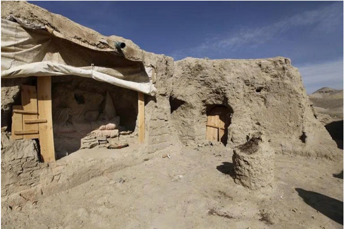
Khu sân trung tâm thuộc phế tích tu viện Kafiriāt tại Mes Aynak đang được khảo cổ.

Ngay tại hồng tâm của trục tọa độ tâm linh vĩ đại đó, vương quốc cổ đại Gandhāra, ôm trọn cả phần lãnh thổ Afghanistan hiểm trở ngày nay, chính là viên ngọc quý tỏa chiếu thứ ánh sáng rực rỡ nhất của nền văn minh và mỹ thuật Phật giáo toàn cầu.