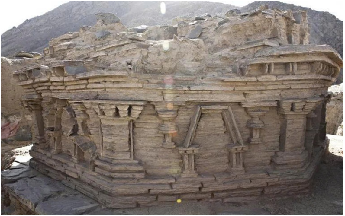
Tháp Bà-sa (stupa) chứa thánh tích tại tu viện Kafiriát thuộc di chỉ Mes Aynak. Tám bia đá mới được tìm thấy ngay cạnh công trình này. Ảnh: US Embassy, Kabul Afghanistan (CC BY-ND 2.0).

Thuở ban đầu, mạch nguồn Phật giáo Nguyên thủy dường như đã đặt dấu chân tiên phong tại vùng đất này, thế nhưng dòng chảy Đại thừa mới là tông phong vươn lên giữ ngôi vị chủ lưu về sau.