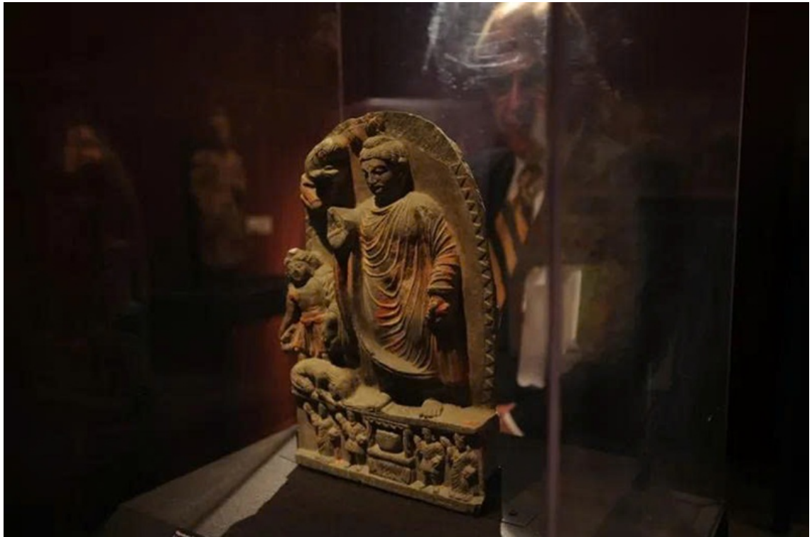
Cấu trúc kiến trúc được khai quật tại khu tầng xá (nơi ở của tăng sĩ) ở Mes Aynak.

kỳ công vào vách núi đá - những kỳ quan nhân loại sau này đã bị Taliban phá hủy một cách tàn nhẫn vào năm 2001. Trong lòng thung lũng đá ấy, người ta tin rằng đã từng có đến 5.000 hành giả ngày đêm tĩnh tọa tu hành trong các thạch động tịch mịch. Dấu dòng chảy thời gian và ngọn lửa bạo tàn của các thế lực cực đoan đã vùi lấp đi bao kiệt tác mỹ thuật quý báu, những tàn tích tự viện, bảo tháp, cùng các pháp khí và xá-lợi thiêng liêng vẫn âm thầm thức giấc, tiếp tục phát lộ dưới lòng đất Afghanistan. Khúc quanh định mệnh ập đến vào thế kỷ VII khi các cuộc viễn chinh Hồi giáo tràn qua, đìu đạo Phật vào làn sóng suy thoái, để rồi đến thế kỷ XI, tiếng chuông chánh pháp hoàn toàn tắt lịm trên mảnh đất Trung Á này.