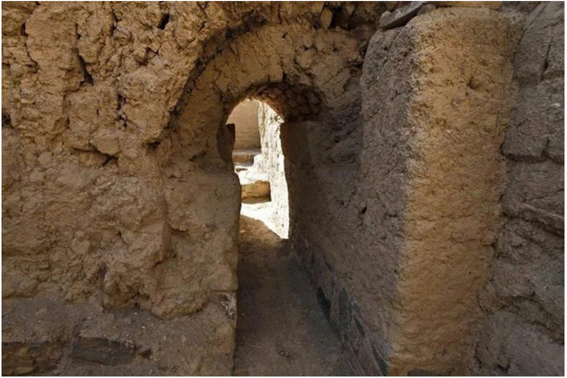
Hành lang tu viện Tepe Kafiriat, Afghanistan, thuộc khu khảo cổ thời kỳ Đế quốc Kushan.

Di sản Con đường Tơ lụa: Từng là hồng tâm của tuyến lộ huyền thoại, nền văn hóa nơi đây là sự giao thoa rực rỡ giữa các nền văn minh Ba Tư (Iran cổ đại), Ấn Độ, Hy Lạp và Trung Cổ. Những phiến thảm thủ công tinh xảo, những vần thơ bất hủ, và trò chơi cưỡi ngựa giật dê (Buzkashi) cuồng nhiệt chính là chứng nhân cho một thời hoàng kim.